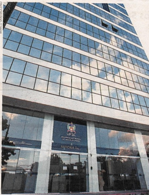
Imbróglia. Edifício que abriga a reitoria foi adquirido por R$ 33 milhões