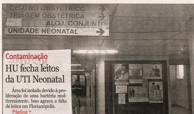
Isolamento. Sete leitos foram fechados por tempo indeterminado na UTI Neonatal do HU, em Florianópolis