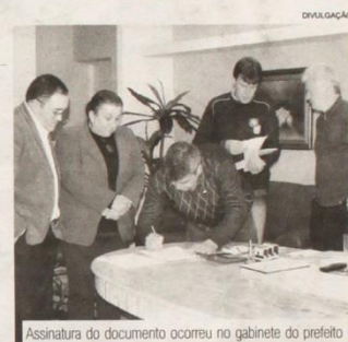
Assinatura do documento ocorreu no gabinete do prefeito