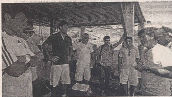
Na ilha. Integrantes da expedição conversam com marinheiros.