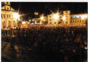
Em São Luiz (Maranhão)