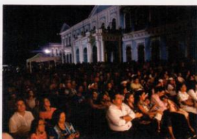
Em Belém (Pará)