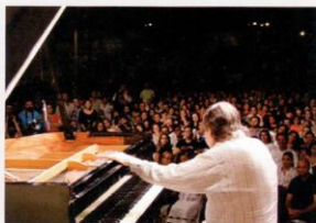
Em Barbalha (Ceará)