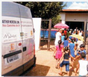
Milhares de crianças, em todo o país, já receberam as orientações e cuidados do projeto Um Sorriso pela Estrada