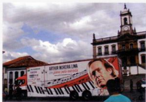
Em Diamantina (Minas Gerais)

O projeto “Um Piano pela Estrada” ainda pretende levar a arte de Arthur Moreira Lima a outras cidades deste imenso Brasil. Temos muitos pedidos de cidades para serem incluídas em nossos roteiros, o que será feito, levando-se em conta sua importância histórica, geográfica, econômica ou política. Atendendo, sobretudo, às mais carentes.