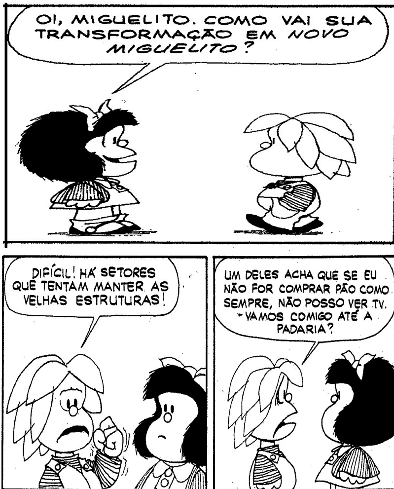
FIGURA 6: Charge Mafalda 06 FONTE: QUINO, 1993.