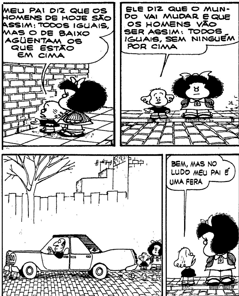
FIGURA 7: Charge Mafalda, 07. FONTE: QUINO, 1993.