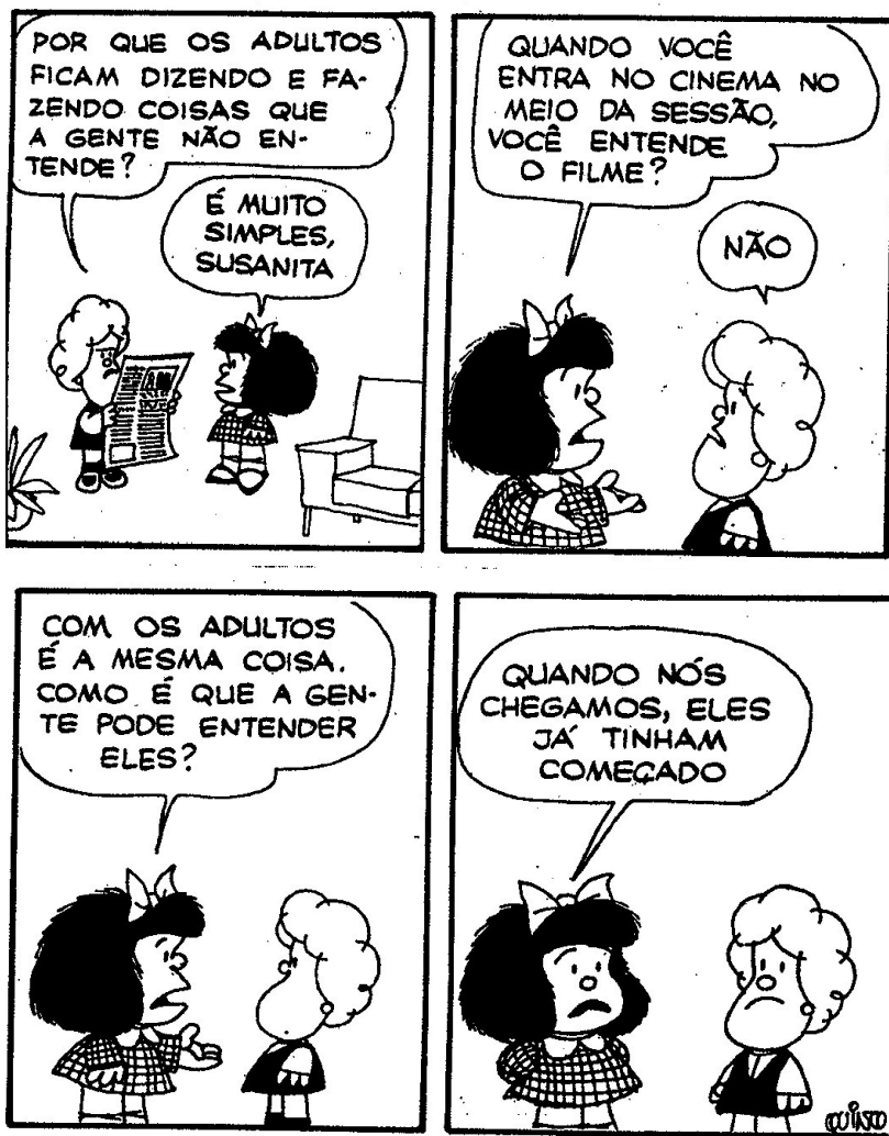
FIGURA 5: Charge Mafalda 05