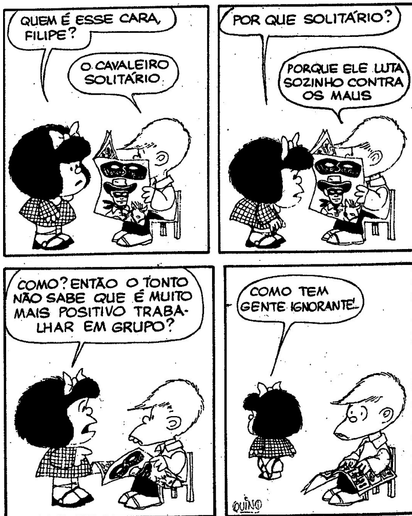
FIGURA 2: Charge Mafalda 02 FONTE: QUINO, 1993.