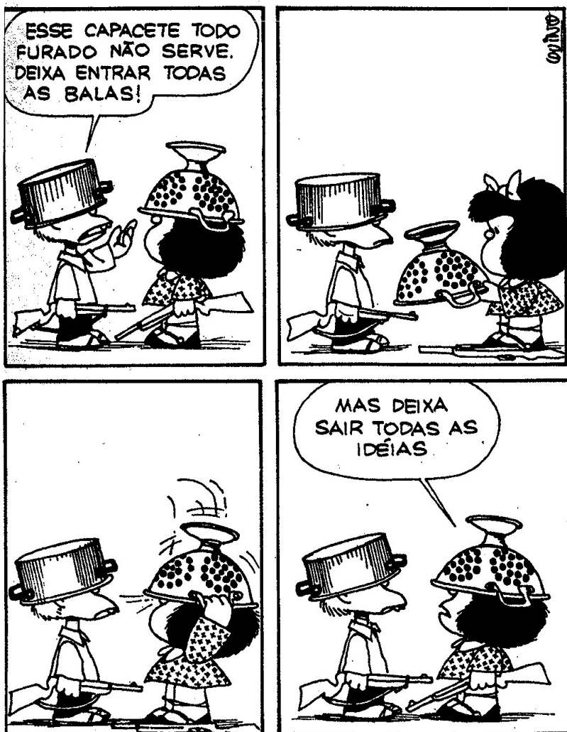
FIGURA 3: Charge Mafalda 03 FONTE: QUINO, 1993.