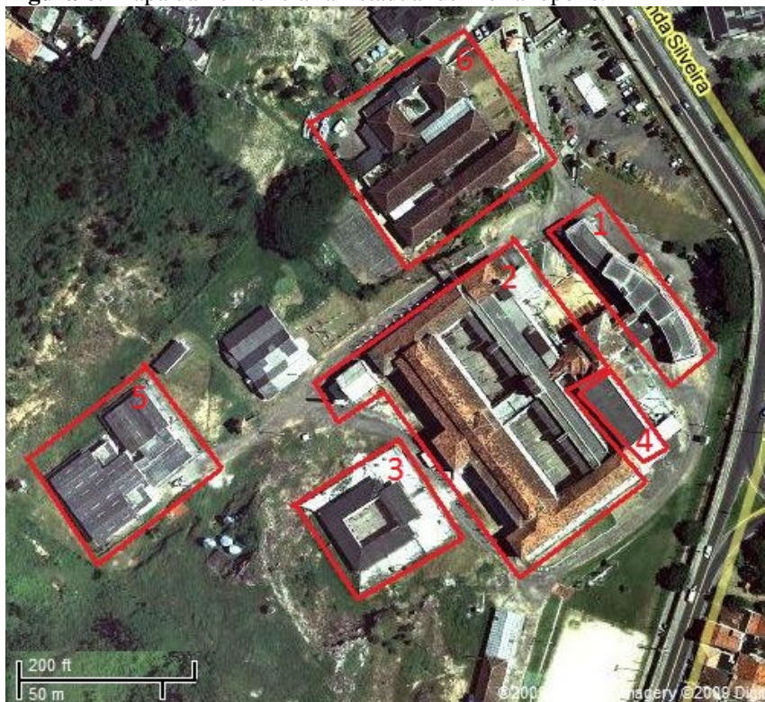
Figura 6: Mapa da Penitenciária Estadual de Florianópolis:

A Penitenciária Estadual de Florianópolis funciona no bairro Agrônômica e é composta por seis prédios principais: