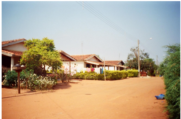
Foto 4: vista das casas de uma das agrovilas da área III, em que os assentados se organizam na COPAVA

A cooperativa já possuiu mini-mercado, mas não foi possível ser mantido. Atualmente possui uma padaria, um viveiro de mudas de árvores nativas e um biodigestor. São produzidos, em seus setores, feijão, milho, arroz, hortaliças, mel, carne de suínos, leite e