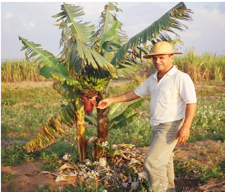
Foto 10: primeiro cacho de bananas a ser colhido na experiência agroecológica. Ao fundo, cana ecológica

Em outros depoimentos, mencionou aprendizados oferecidos pela oficina de SAF relativos ao manejo da braquiária e sobre a técnica para poda da goiabeira, para permitir que outras plantas recebam luz. Por meio da compreensão obtida sobre a necessidade da poda e de sua função, ele se convenceu, definitivamente, de que é possível ter árvores entre outros cultivos.