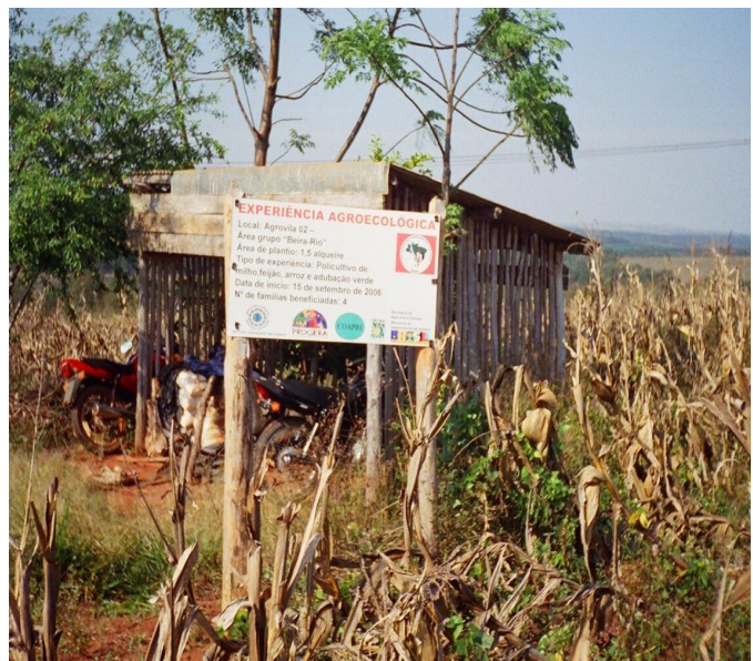
Foto 7: placa sobre a experiência agroecológica do grupo Beira-Rio, em sua entrada, divulgando-a

Quem participa das reuniões para discussão e, também, do monitoramento com o técnico, são os três principais integrantes do grupo. Através de entrevista com o representante, obteve-se a informação sobre quem participava mais, e quem participava menos da experiência, entre os três agricultores. Considerou-se, em função da interpretação dos agricultores, que os que participam mais são os que se envolvem no