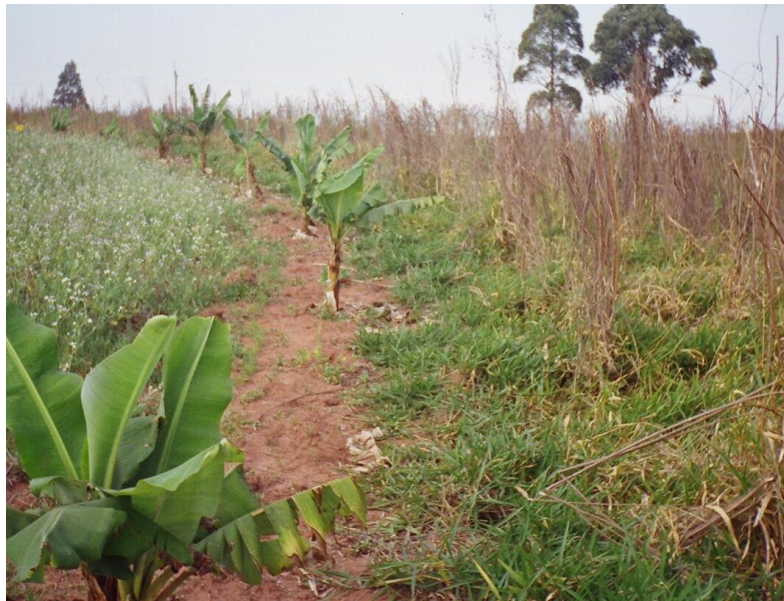
Foto 8: fileira de bananeiras entre diferentes espécies de adubos verdes, na experiência da COPAVA.

oficinas que seriam oferecidas pelo PROGERA. Segundo ele, foram os agricultores que solicitaram, por exemplo, a oficina de biofertilizantes, que foi oferecida pelo Instituto Giramundo a todos os interessados. No entanto, constatou-se que o poder de