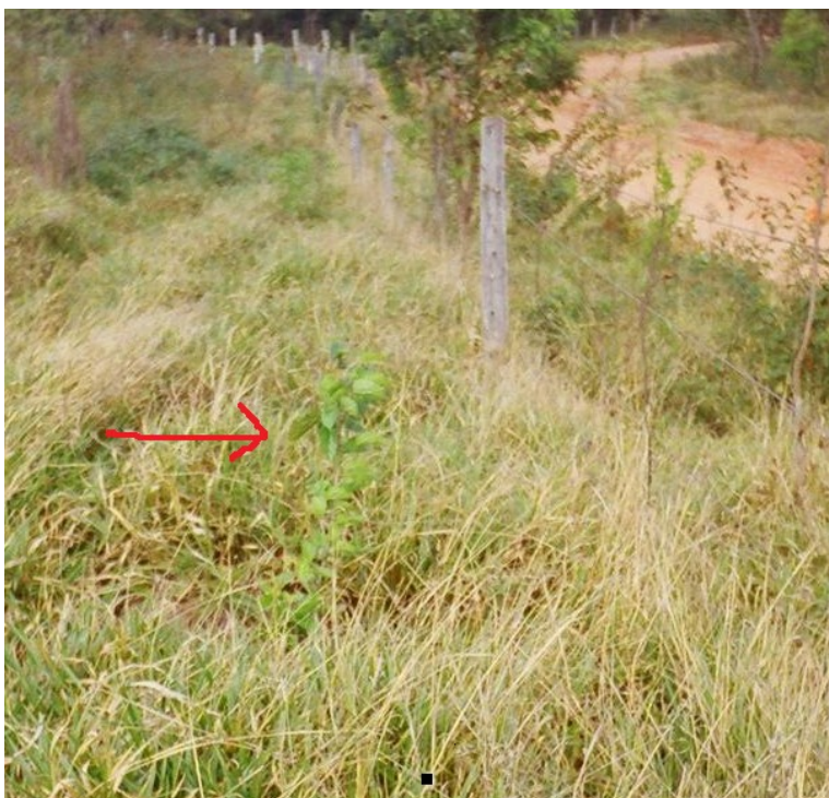
Foto 11: cerca viva da experiência agroecológica, composta por amoreiras e astrapéias.

(AF3/B) demonstrou ter-se apropriado de conhecimentos sobre as técnicas ecológicas de manejo utilizadas na experiência. Explicou seu entendimento sobre o plantio de banana e de café, no meio dos outros cultivos, como sendo para “(...) segurar o vento, acho que pra num ir nas outras pranta, né? (...)”. Demonstrou entender,