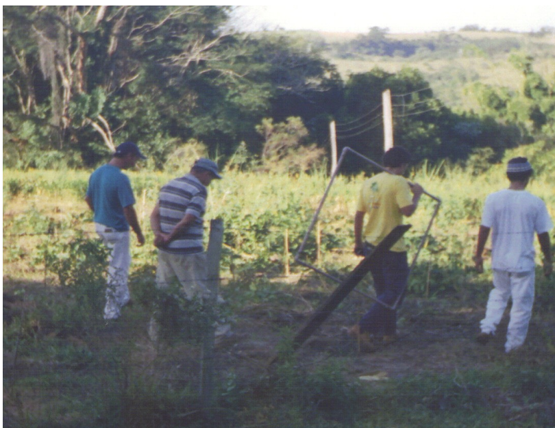
Foto 9: monitoramento da cobertura do solo em experiência agroecológica do Projeto Gigante Guarani, no entorno de Botucatu, SP, acompanhado em observação participante.

Ele quer dizer que, através da ficha de monitoramento, se a preenchesse, alguns aspectos (os ambientais) já seriam acompanhados com certa frequência, facilitando depois, para as reuniões sobre avaliação. Nesse caso, portanto, quando ele fala em facilitar, significa que se abdicou da participação de todos e o monitoramento dos indicadores ambientais ficou centralizado no