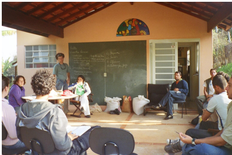
Foto 1: reunião semanal da equipe do instituto, em sua sede, acompanhada em observação participante

A equipe de extensionistas do Instituto Giramundo Mutuando (foto 1), na ocasião da pesquisa, era composta por dois engenheiros florestais, uma veterinária e um agrônomo. Sua coordenação era composta por dois veterinários, um agrônomo (o mesmo que atua como extensionista), uma psicóloga e educadora popular, uma