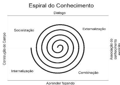
Figura 3 – Espiral do conhecimento.

Os autores questionaram a visão ocidental de conhecimento, por esta se dar de forma dicotômica. O conhecimento é criado pelos gerentes de nível médio e são considerados como o “nó estratégico que liga a alta gerência aos gerentes da linha de frente”, desempenhando um papel chave na facilitação da criação do conhecimento organizacional (NONAKA e TAKEUCHI 1997, p.146).