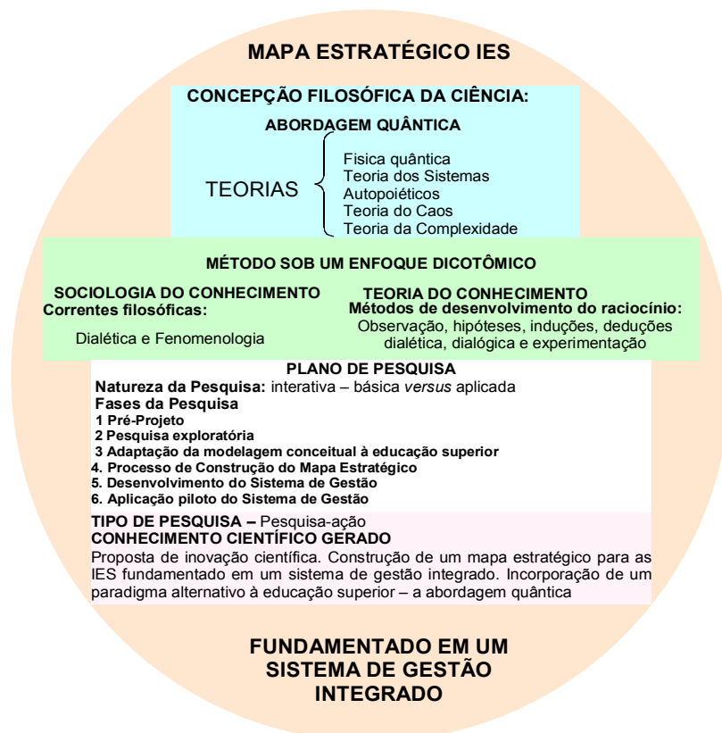
Figura 1: Delineamento Metodológico do Mapa Estratégico para as IES fundamentado em um Sistema de Gestão Integrado

A Figura 1 apresenta o delineamento metodológico deste estudo. Classificando a pesquisa na sua concepção filosófica, enquadra-se na abordagem quântica sob os fundamentos de algumas ciências da complexidade: física quântica, teoria dos sistemas autopoieticos, teoria do caos e teoria da complexidade.