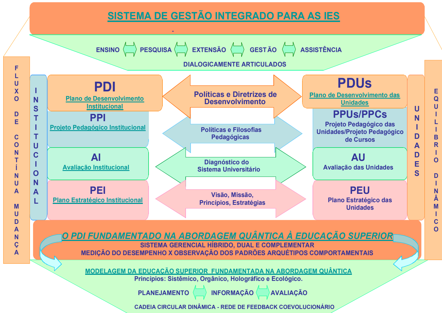
Figura 2: Sistema de Gestão para as IES: Uma proposta metodológica para a operacionalização do PDI fundamentado na Abordagem Quântica