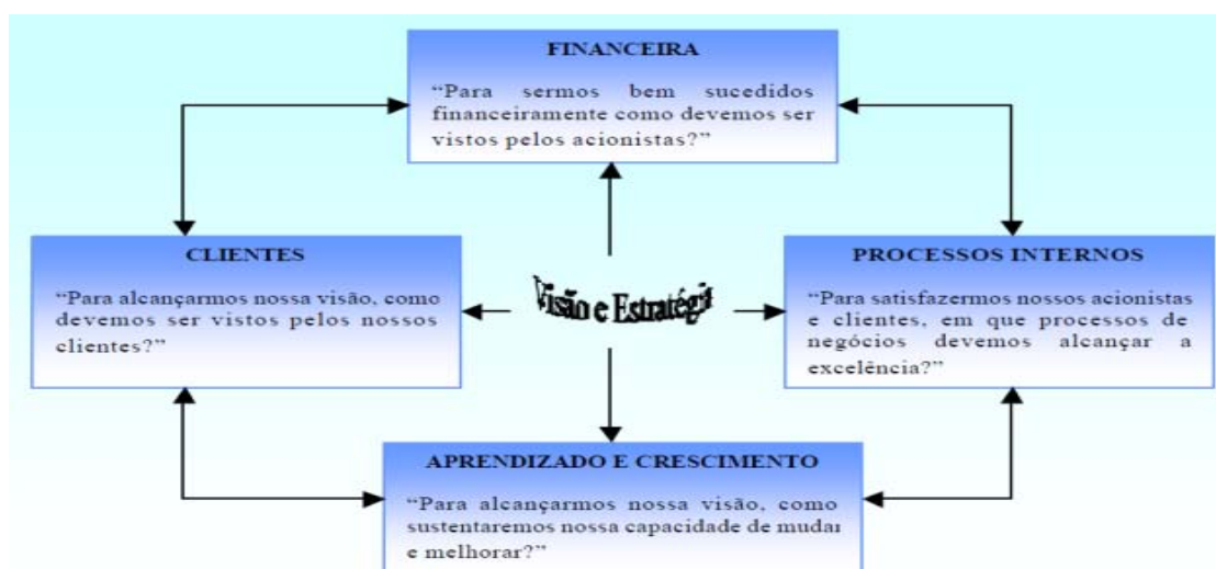
Figura 1: Perspectivas do balanced scorecard

O modelo básico de balanced scorecard concebido por Kaplan e Norton (1997) possui quatro perspectivas: financeira, clientes, processos internos e aprendizado e crescimento (Figura 1). Contudo, em decorrência do setor de negócio e da estratégia da organização, pode-se fazer necessário agregar outras perspectivas ao modelo.