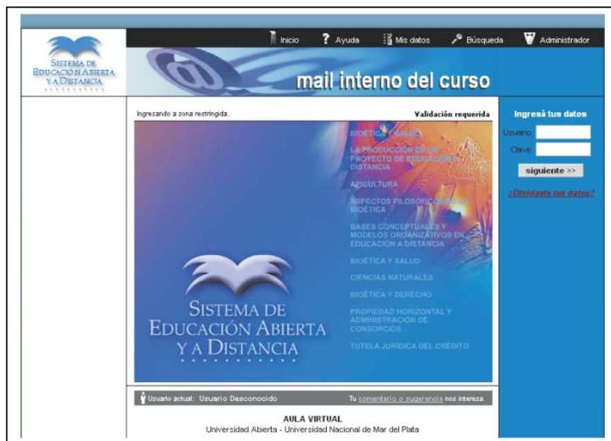
Fig. 4. Entorno virtual del Campus Virtual de la UNMdP.