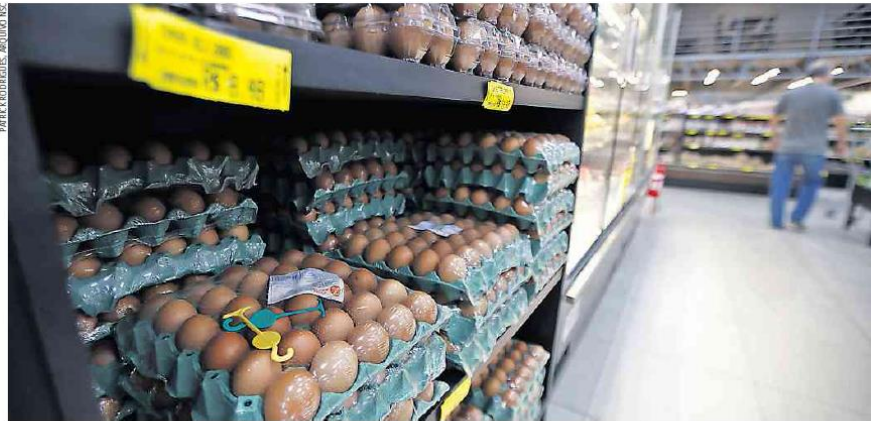
Forte demanda por ovos se dá também pelo aumento dos preços das carnes bovinas, de frango e suínas

— Nutricionalmente, o ovo é importante porque é uma proteína de alto valor biológico. Todos os aminoácidos essenciais estão presentes nele — esclarece.