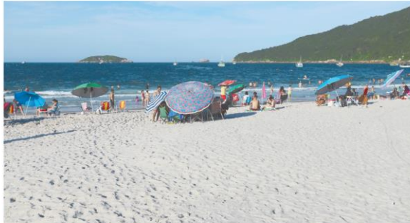
Ingleses, no Norte da Ilha, tem primeira temporada com orla maior para moradores e turistas