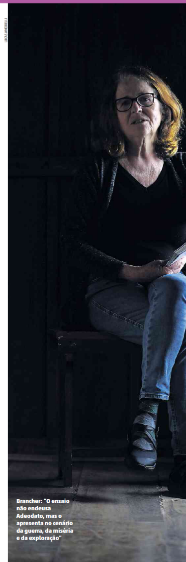
Brancher: “O ensaio não endeusa Adeodato, mas o apresenta no cenário da guerra, da miséria e da exploração”

— Essas histórias estão começando a vir à tona, principalmente, pelo trabalho de pesquisadores e pesquisadoras negras. A importância desse livro está em ajudar a mostrar que o estado catarinense, assim como o brasileiro, é resultado da multiplicidade étnica.