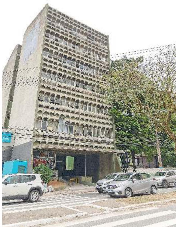
Emblemático prédio do Ibama, na avenida Mauro Ramos, guarda arquivo

O Ibama ainda informou que a UFSC (Universidade Federal de Santa Catarina) manifestou interesse pelo imóvel, mas o processo está em tramitação. “Reforçamos que o prédio não está abandonado, tem vigilância 24 horas, e estamos avançando no processo de doação para a União”, conclui a nota.