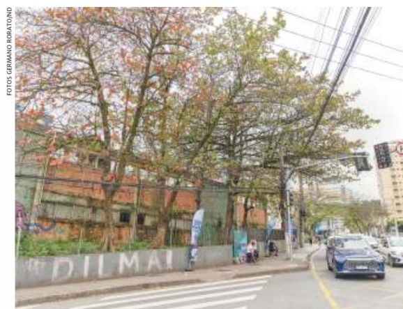
Abandono de mais de 20 anos do imóvel do INSS está perto de um desfecho