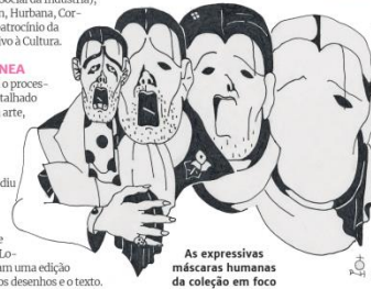
As expressivas máscaras humanas da coleção em foco