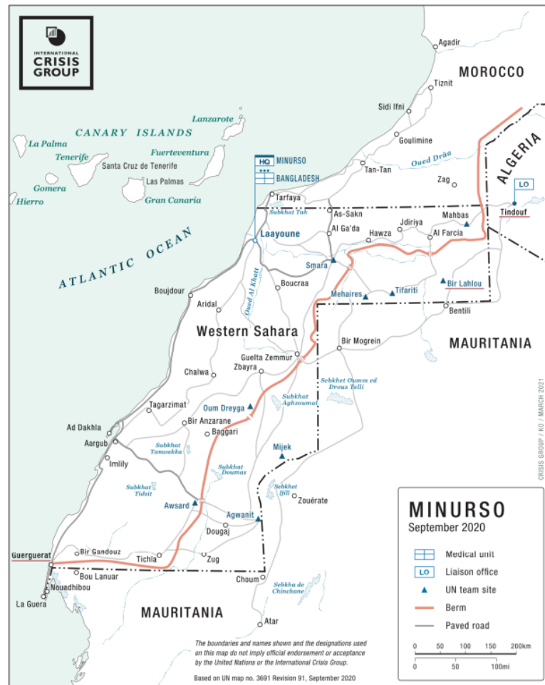
Figura 3 - Saara Ocidental