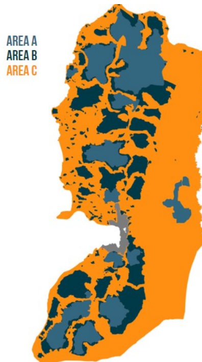
Figura 2 - Território Palestino Ocupado