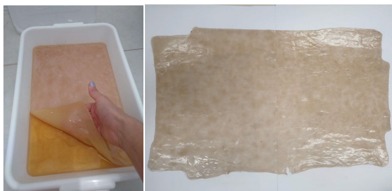
Figura 1: Celulose bacteriana.

Na segunda etapa foi realizado o processo de cultivo da celulose bacteriana seguindo a metodologia do curso Fabteria. O cultivo foi produzido a partir da mistura do chá preto, açúcar cristal, líquido de bactérias ativas e o Scoby, membrana de celulose bacteriana que vem acompanhada do líquido ativador, comprados da distribuidora The Kombucha Hub. A mistura de elementos permanece em cultivo estático durante quatorze dias, em local ventilado, sem incidência de luz direta e com temperatura entre 23-30°C. Ao final do processo é esperado que todo o chá e açúcar adicionado se convertam em líquido com bactérias ativas e será utilizado para recriar o processo. Após o período de incubação, o material é recolhido, lavado e higienizado (figura 1) para a realização da pré-secagem, que diz respeito a secar o material até reduzir metade de sua espessura, podendo ser em uma centrífuga ou à luz do sol. A seguir, foi realizada a hidratação da membrana com glicerina, espalhando-a por toda a extensão do material, deixando-a secar com exposição a uma fonte de vento constante até não sobrar glicerina residual.