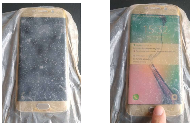
Figura 4: Teste da película fina de celulose bacteriana sobre a tela de smartphone.

Considerando que o material, apesar de ter uma textura característica, tem forte apelo por sua translucidez, ele acaba por ter uso potencial para proteção de telas. Quando aplicado na tela de smartphone , observou-se que mantém as características da tecnologia touch permitindo seu uso sob a película (figura 4).