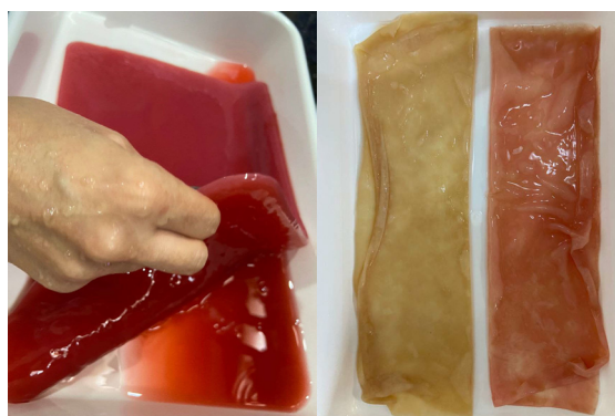
Figura 2: Amostras de celulose bacteriana produzida com chá de hibisco (esquerda), chá de hortelã (ao centro) e chá de folha de repolho roxo (direita).

O cultivo em mistura de partes iguais de chá de hibisco e chá preto resultou em espessuras satisfatórias entre 6 e 8 mm. Foram testados também chás de hortelã e de folha de repolho roxo, que resultaram em espessuras insatisfatórias de menos de 1 mm. Com objetivo de obter diferentes colorações, o teste apontou que o material retorna às tonalidades terrosas quando é desidratado (figura 2).