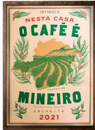
Figura 5: Cartaz da colheita de 2021 do Café Jetiboca.