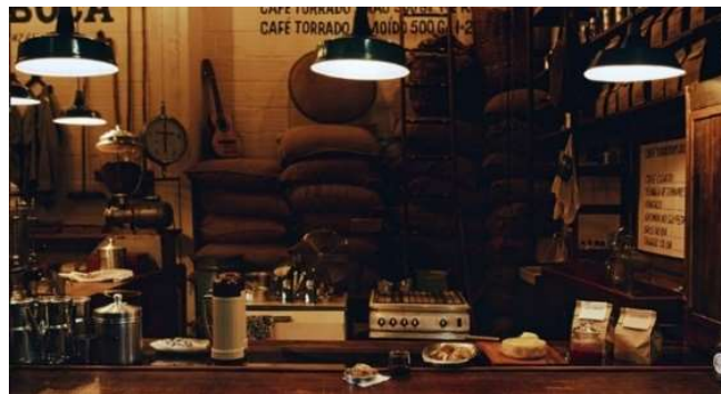
Figura 2: Interior do Café Jetiboca no Mercado Novo.

balança, escada, viola, cabideiro, roupas de trabalho, vassouras, pás. Tudo é velho. Se for novo, é tradicional. As informações foram pintadas à mão nas paredes, com caligrafia muito própria da utilizada em comércios populares. A placa do estabelecimento, assim como os uniformes e grande parte do material gráfico, foi feita no mercado. É importante destacar que a iluminação quente, direcionada e com muitas sombras tem um papel fundamental na criação da ambiência aconchegante, muito próxima de uma iluminação feita com velas ou lamparinas. As sombras, ao envolver os espaços e objetos, criam áreas que não podem ser vistas e que por esse motivo convocam a imaginação e novos olhares. O cheiro e o gosto do café ampliam a experiência desse mundo, que remete à casa do interior rural pouquíssimo iluminada. Segundo Quick “o que a gente fez foi trazer a cultura da fazenda e mostrar que é maravilhosa, tem muito valor [...]. A galera entra aqui e chora. É normal, cotidiano” [11].