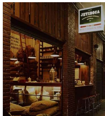
Figura 1: Vista da loja do Café Jetiboca no Mercado Novo.

Os novos empreendimentos devem dialogar com as formas, as cores, os materiais, as texturas e a diversidade de atividades já existentes. Há comerciantes de frutas, verduras, alimentos, placas, uniformes, embalagens, velas, entre outras atividades, como gráficas e serviços elétricos. É essa constituição original e tradicional na cidade que serve como referência para o novo. Placas, uniformes e material gráfico dos novos negócios são produzidos no Mercado, que também abastece os empreendimentos gastronômicos. Os novos interiores se caracterizam pela rusticidade, que é própria do mercado, e pela reutilização de mobiliários e objetos, muitas vezes provenientes de vendas e antigos armazéns. Muitos dos novos negócios são de pequenos produtores interessados na cultura mineira, na sua experiência na contemporaneidade.