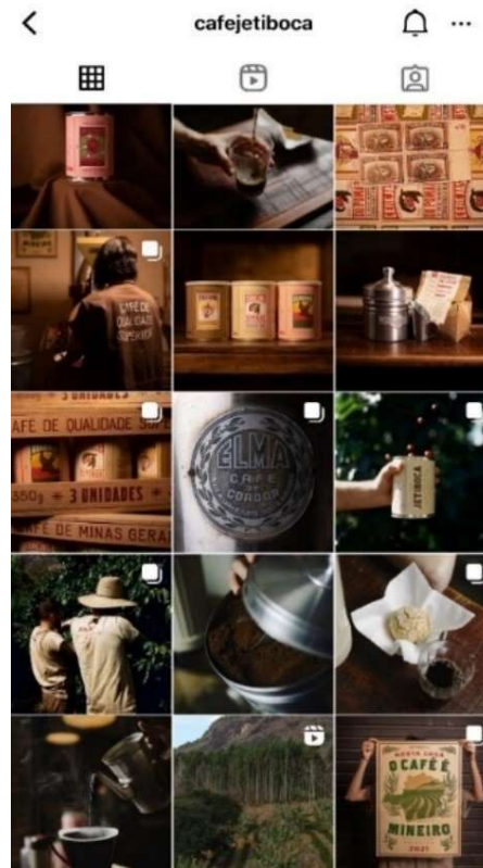
Figura 4: Parte do feed do Instagram do Café Jetiboca.

As cenas são capturadas sob uma luz com muitas sombras, que configuram veladuras para o objeto, produto ou paisagem. Apenas as artes gráficas possuem uma iluminação homogênea quando divulgadas. No tempo da colheita do café, mais imagens são divulgadas no feed e nos stories . Imagens de todas as colheitas, desde 2019, estão organizadas por ano e fixadas como highlights . A colheita é, de fato, um ponto alto na constituição imaginário da marca, que almeja valorizar a fazenda. Se não é possível participar do evento na fazenda, aberto a interessados, amigos e convidados, é possível ver as imagens da colheita, dos momentos de trabalho e celebração da natureza, tão incomuns na cidade. Para cada colheita anual, é feito um cartaz que comemora esse tempo, como o de 2021, visto na Figura 5.