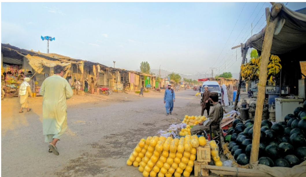
Figura 7: Rua comercial.