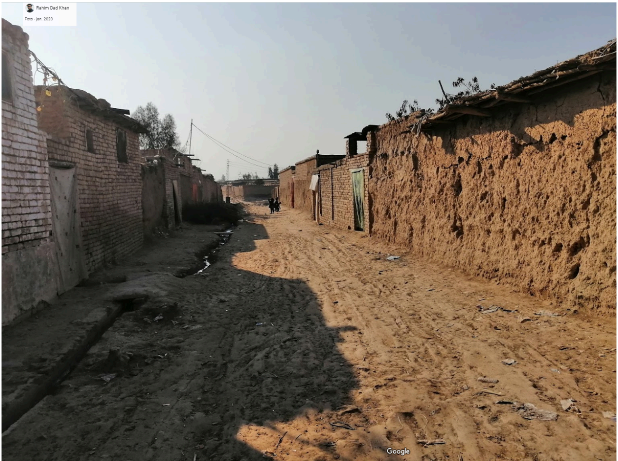
Figura 9: Edificações de alvenaria e terra.