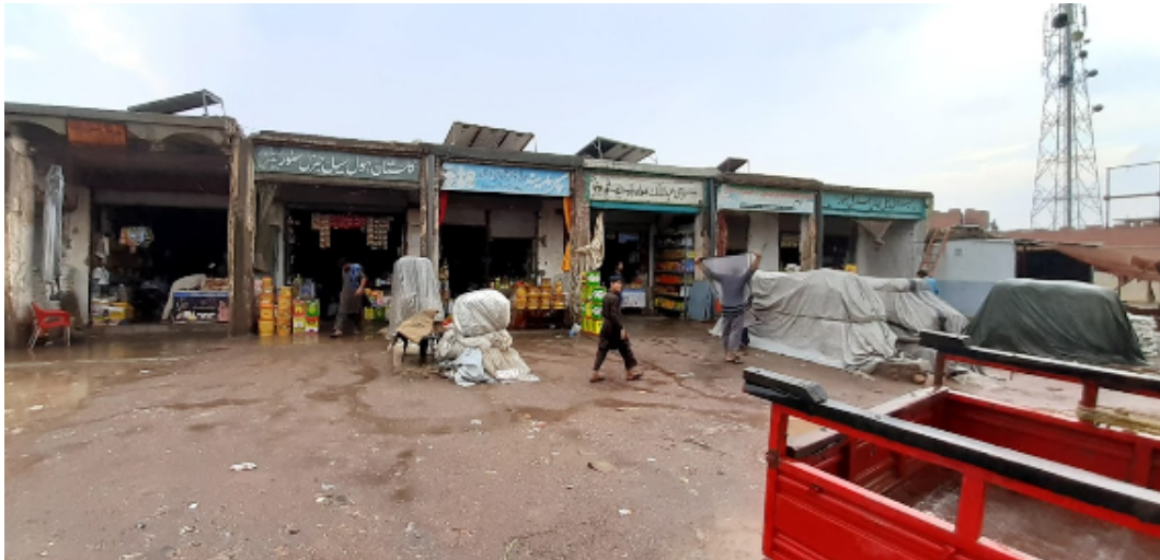
Figura 6: Rua comercial.