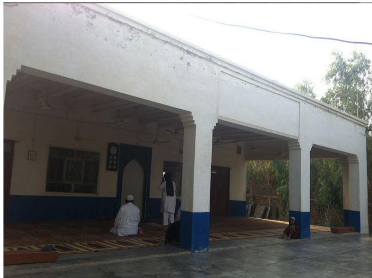
Figura 5: Mesquita em Shamshatoo.

Há uma mesquita principal e cerca de 38 mesquitas menores no local (Muzhary, 2017).