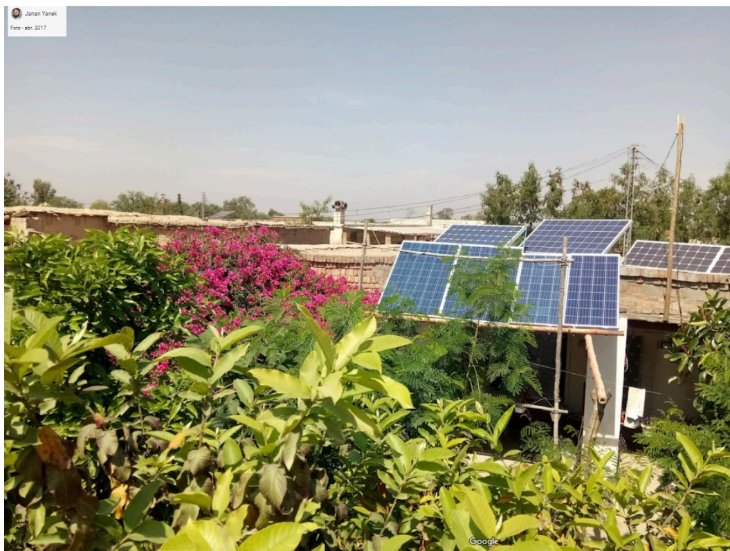
Figura 7: Placas fotovoltaicas nos telhados das edificações.

Não foram obtidas informações oficiais. É possível perceber a presença de algumas placas fotovoltaicas em imagens compartilhadas da vila nas avaliações do google (Figura 7).