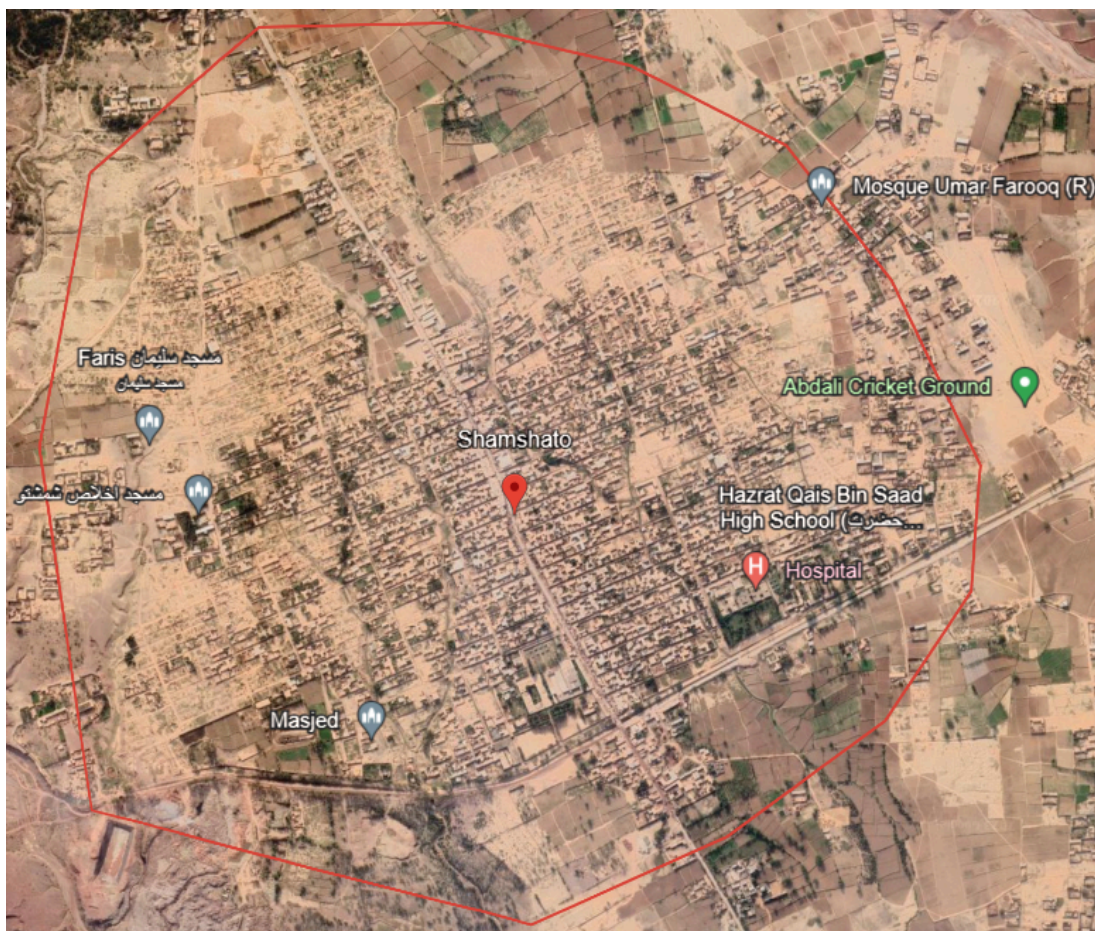
Figura 2: Vila de refugiados de Shamshatoo.