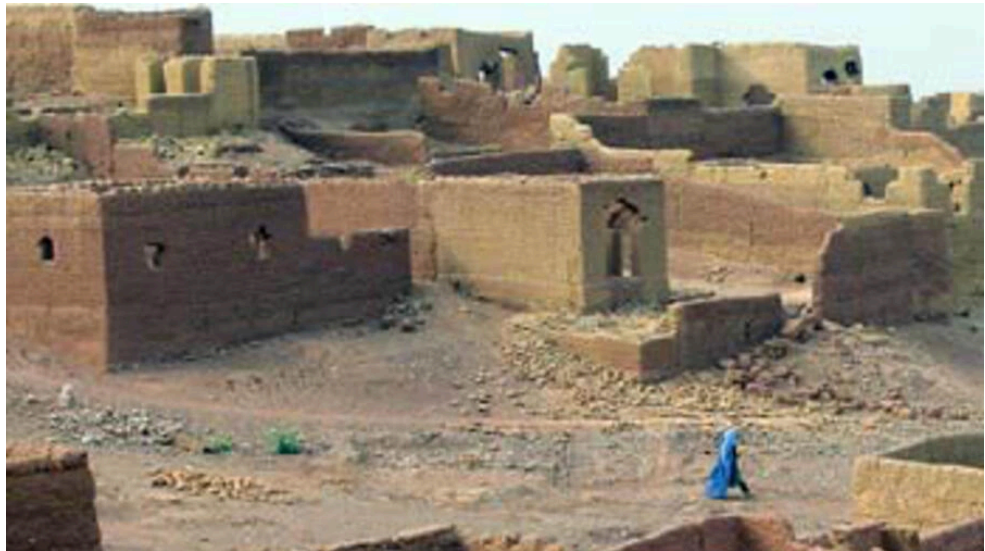
Figura 4: Ruínas em Shamshatoo.

Como muitas das edificações da vila, as escolas são feitas com alvenaria.