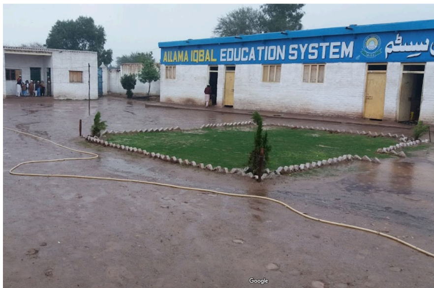
Figura 3: Escolha para meninos.

Há registro de diversas escolas e espaços educacionais em Shamshatoo, alguns separados por gênero. Além disso, havia uma universidade jihadista destinada para treinamento de soldados, que foi fechada na década de 90 (Muzhary, 2017).