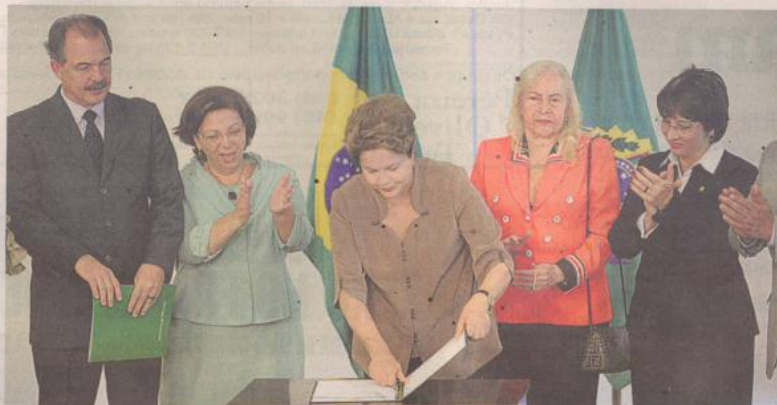
Na cerimônia, presidente frisou a democratização do acesso às faculdades e a manutenção da meritocracia

Com isso, Santa Catarina terá que reservar, nos próximos quatro anos, mais 1,6 mil vagas para estudantes cotistas, sendo 1,2 mil na UFSC e as demais na Universidade Federal da Fronteira Sul, com sede em Chapecó. O Instituto Federal de Santa Catarina já reserva a metade