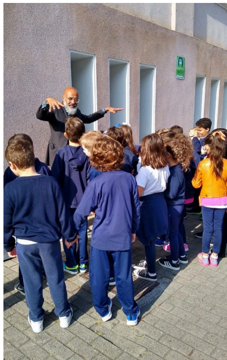
Figura 9: O artista fazendo a mediação para o público escolar.