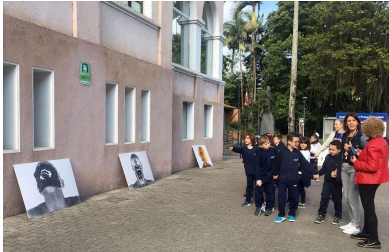
Figura 8: O público em frente à obra do artista exposta no exterior do prédio da Secretaria de Cultura de SC.

O artista frente à sua obra e seu público, expõe de maneira categórica a ideia central de seu trabalho, mediando a troca proposta entre a exposição e o público. Através destas imagens nota-se a forma como Sérgio conduz o seu trabalho junto ao público, às crianças que o observam explicar sobre o que significa o seu trabalho: