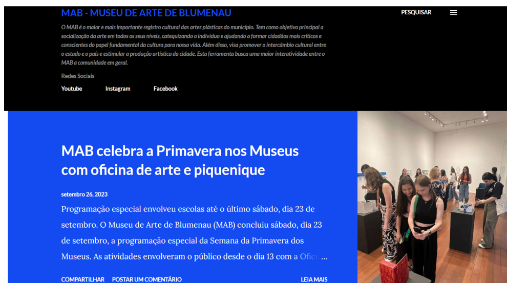
Figura 7: print da página inicial do blog do museu. Fonte: 15

O MAB é o maior e mais importante registro cultural das artes plásticas do município. Tem como objetivo principal a socialização da arte em todos os seus níveis, catequizando o indivíduo e ajudando a formar cidadãos mais críticos e conscientes do papel fundamental da cultura para nossa vida. Além disso, visa promover o intercâmbio cultural entre o Estado e o país e estimular a produção artística da cidade. Para saber mais, acesse o blog do MAB ou entre em contato pelo 3381.6176. Horário de funcionamento: das 10h às 16h. (MAB - Museu de Arte de Blumenau, 2023)