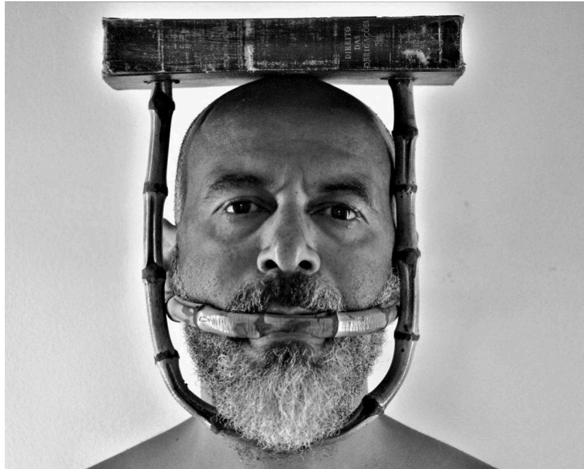
Figura 1: série Palavras tomadas ordem e progresso - direto das obrigações (2020)