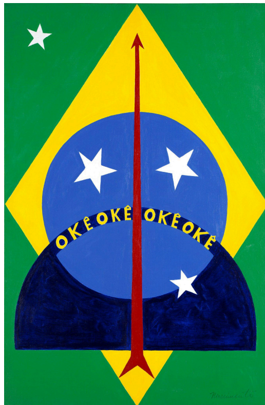
Figura 5: Oké Oxóssi , Abdias Nascimento, 1970.

Na arte e criação pautada no existir categórico e rico de influências do seu povo africano, que apresenta um vasto conhecimento no universo artístico que designa cores vivas, traços geométricos correspondentes ao modo de representar orixás e símbolos africanos expressivos e memoráveis de uma riqueza inigualável, como na obra de Abdias Nascimento Oké Oxóssi (1970) que é uma das obras mais emblemáticas da história da arte mundial: