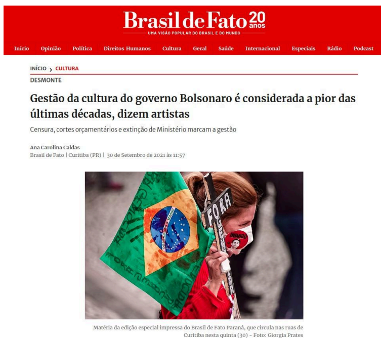
Figura 2: matéria sobre o sucateamento da cultura nos anos que se sucederam ao governo de Jair Messias Bolsonaro.

Segundo consta na matéria, os 1460 dias foram de terror para diversas áreas do conhecimento, uma vez que a verba para a educação como um todo, foi profundamente defasada, causando dificuldades extremas durante todo o período.