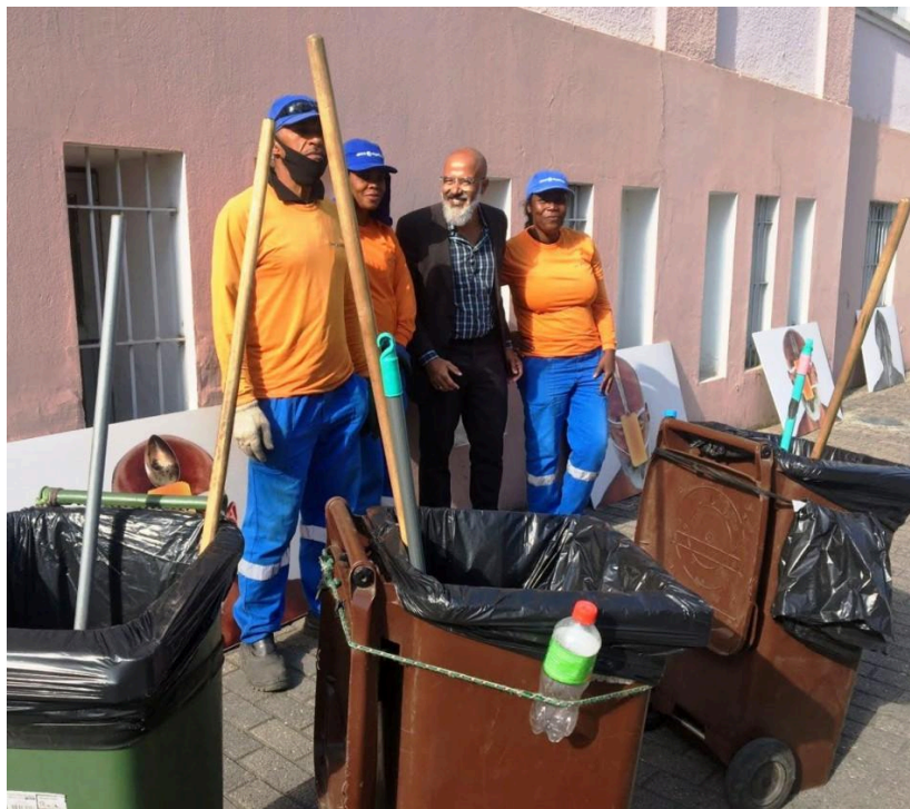
Figura 10: O artista e os trabalhadores do serviço de limpeza

diante do que ele produz. É certamente a forma como o artista se propõe a trabalhar sua exposição, mantendo o público próximo da obra propositalmente exposta na rua, em frente aos prédios e fachadas, que reverberam na sua ação e que é abastada do contato entre o artista e o público. Tal movimento é consistente com a complexidade do seu trabalho em si: a execução proposta é produzida frente ao que nos deparamos enquanto sociedade, vivendo perante uma pandemia, que envolvia diversas camadas sociais sendo dimensionadas em diversos setores e administradas conforme o contexto mudava.