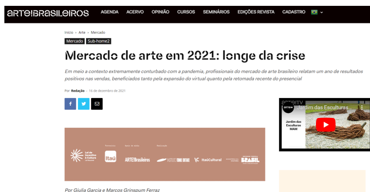
Figura 6: Captura de tela da matéria supracitada. 11

Por outro lado, vê-se que ao sobreviver ao primeiro ano de pandemia mesmo diante das adversidades, o mercado da arte demonstrava-se aquecido, segundo consta na matéria do site Arte Brasileiros . O texto na matéria refere-se ao conteúdo expandido que a arte brasileira e de leilões haviam se deparado ao final do ano de 2021, segundo entrevistas concedidas pelos galeristas, naquela época.