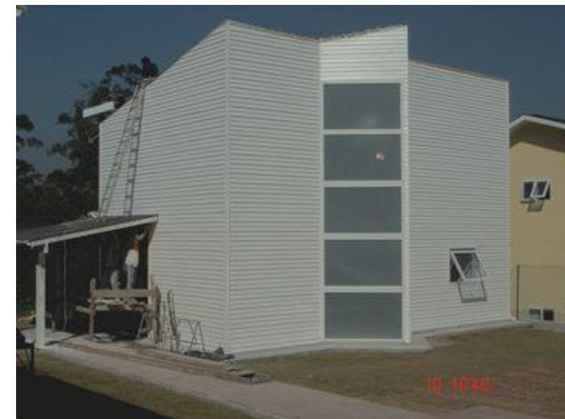
Finalização: Obra acabada