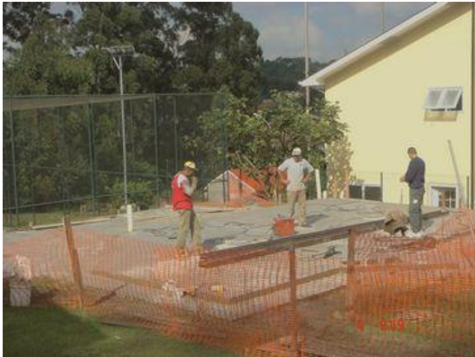
Início da montagem dos painéis de estrutura metálica em steel frame.

Materiais: PERFIS METÁLICOS, PARAFUSOS AUTOBROCANTES