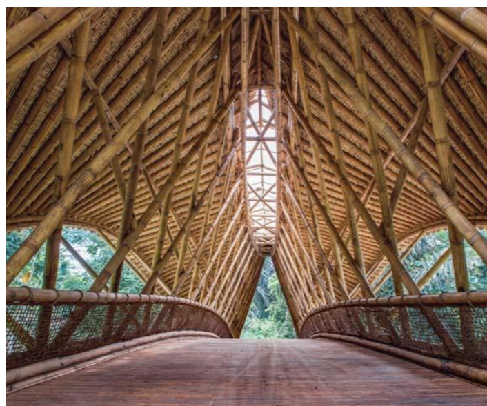
Figura 6: Estrutura em 3 camadas da cobertura.