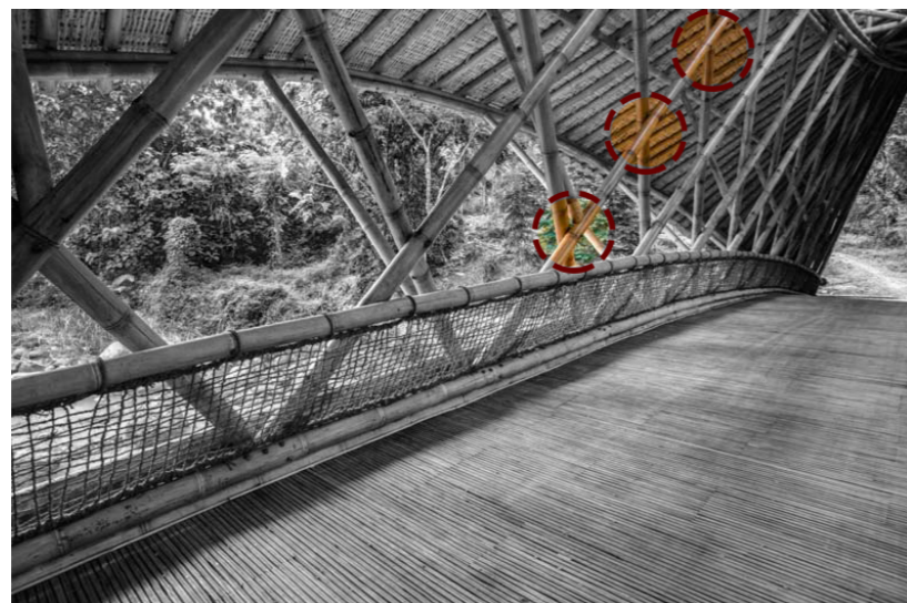
Figura 4: 3 pontos de conexão do pilar. Fonte: Adaptado com base em JORGSTAMM (2022).

Em relação à cobertura, segundo Jin Low (2022), a obra adotou o método de bambu bangli, que consiste em três camadas, baseado na versão tradicional de telhas de cinco camadas originárias do distrito de Bangli, em Bali. A base é construída com caibros da mesma espécie de bambu utilizada na ponte ( Dendrocalamus asper ), e as peças são lançadas com espaçamento de 60 cm e apoiadas sobre as terças sustentadas pelas vigas longitudinais descritas na figura 1. Na camada superior, são posicionadas as ripas ou sarrafos de bambu asper, com conexão nas vigas por meio de pinos de bambu com 12 cm de espaçamento. Na última camada, vem o plano de telhas (40 cm) que cobre a estrutura, composto de bambu Gigantichloa pruriens em formato retangular com chanframento em sua extremidade. A parte posterior da telha consiste de uma lâmina solta na ponta, que se encaixa nas ripas. As telhas são dispostas de 8 a 12 cm de distância devido à retração ocasionada pela secagem natural, já que são posicionadas na cobertura ainda úmidas, em estado verde e sem revestimento. Esta adoção ocorre em razão de formarem uma camada natural de cera que protege o material contra fungos (Figura 5) (JIN LOW, 2022).