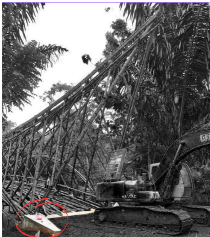
Figura 1: Fundação de concreto. Fonte: Adaptado com base em JORGSTAMM (2022).

Na sequência, para a estruturação da ponte utilizou-se de três colmos de bambu (em vermelho) nas extremidades conectados com barra de ferro rosqueada. Para a estruturação do piso, foi necessário posicionar vigas transversais compostas de 2 colmos de bambu (em amarelo) que estão apoiando tanto a esta viga em vermelho como os colmos estruturais do piso (em verde). Estes elementos que conferem sustentação do assoalho, como também aos pilares (em azul) (Figura 2).