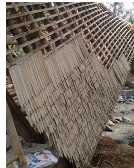
Figura 5: Estrutura em 3 camadas da cobertura.

Em relação à cobertura, segundo Jin Low (2022), a obra adotou o método de bambu bangli, que consiste em três camadas, baseado na versão tradicional de telhas de cinco camadas originárias do distrito de Bangli, em Bali. A base é construída com caibros da mesma espécie de bambu utilizada na ponte ( Dendrocalamus asper ), e as peças são lançadas com espaçamento de 60 cm e apoiadas sobre as terças sustentadas pelas vigas longitudinais descritas na figura 1. Na camada superior, são posicionadas as ripas ou sarrafos de bambu asper, com conexão nas vigas por meio de pinos de bambu com 12 cm de espaçamento. Na última camada, vem o plano de telhas (40 cm) que cobre a estrutura, composto de bambu Gigantichloa pruriens em formato retangular com chanframento em sua extremidade. A parte posterior da telha consiste de uma lâmina solta na ponta, que se encaixa nas ripas. As telhas são dispostas de 8 a 12 cm de distância devido à retração ocasionada pela secagem natural, já que são posicionadas na cobertura ainda úmidas, em estado verde e sem revestimento. Esta adoção ocorre em razão de formarem uma camada natural de cera que protege o material contra fungos (Figura 5) (JIN LOW, 2022).