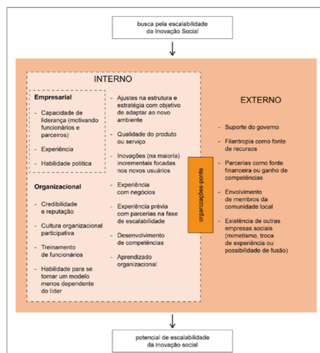
Figura 1: Fatores promotores da escalabilidade.

Baseados na metodologia de meta-síntese, os autores analisaram nove artigos da base de dados Web of Science sobre ganho de escala em casos para Inovação Social. Após análise individual de cada artigo, exploraram os insights gerados acerca das características que proporcionariam a ampliação de uma Inovação Social. Como resultado, foram desenvolvidas redes causais para cada caso, a fim de visualizar padrões que se repetiam. Com o cruzamento das redes, criou-se uma rede meta-causal (Figura 1) que consolida as principais características de um ambiente propício à expansão de uma Inovação Social. A análise revelou a existência de dois ambientes: um interno e um externo. A partir desses elementos, foi possível identificar quais fatores contribuíram para o ganho de escala no projeto “Voz das Comunidades” (Figura 2).