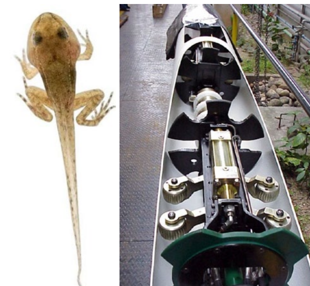
Figuras 3 e 4: inspiração e invenção: um girino em estágio de desenvolvimento com patas e o robô G.I.R.I.N.O.

“À medida que vão crescendo, os anuros adotam diferentes meios de locomoção. Antes de desenvolver os quatro membros definitivos da etapa adulta, a larva vive em áreas com água parada, como lagos e charcos, ou em água corrente, como riachos. Nestes meios os girinos usam uma cauda para tomar impulso dentro da água. Na passagem da vida aquática à vida terrestre, o crescimento das extremidades dá um movimento peculiar a estes animais. Primeiro, seu corpo alongado se estende na direção de translação, se apoiando nas patas traseiras. Nesta posição os membros anteriores se fixam na superfície, enquanto os posteriores ficam livres. A seguir o organismo se retrai assumindo o aspecto inicial, porém em uma posição diferente. Esta simples sucessão de movimentos apontou o nascimento de uma tecnologia em pleno desenvolvimento: o Gabarito Interno Robótico de Incidência Normal ao Oleoduto - GIRINO. (PANTA, 2005).