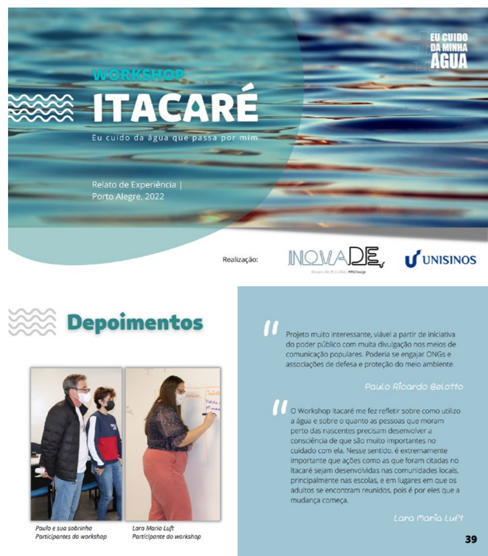
Figura 7 – Páginas do Ebook do Workshop Itacaré .

a reflexão e a teorização sobre o processo. Também foi solicitado aos participantes do evento que colaborassem com a construção do documento compartilhando suas impressões e aprendizagens. Ainda, o mapa interativo desenvolvido foi atualizado e segue aberto para registrar os próximos movimentos do Projeto Itacaré, constituindo-se como um acervo e podendo ser utilizado em diversos momentos futuros, como forma de apresentação do projeto, na síntese de novas proposições, na captação de recursos etc.