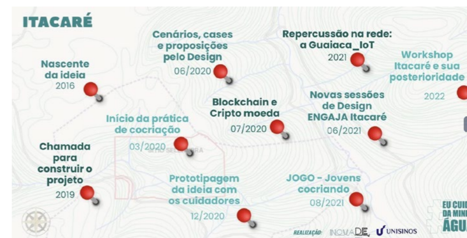
Figura 1 – Mapa disponibilizado do Workshop Itacaré.

O primeiro movimento do WS Itacaré ocorreu previamente à data do evento em si, pois entendeu-se que era necessário revisitar o processo do projeto e mapear seu percurso (Figura 1) a fim de propiciar que os participantes pudessem se apropriar do processo de forma a terem condições de refletir sobre os novos trajetos possíveis e definir como o projeto poderia se desenvolver durante o encontro do workshop .