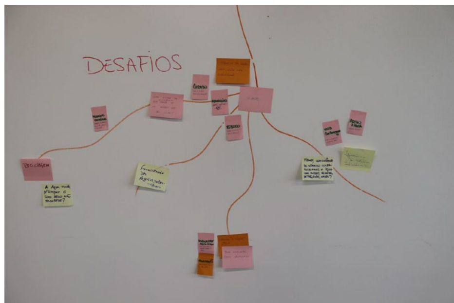
Figura 4: Parte inferior do diagrama

O terceiro momento, visões de impacto, teve o intuito de fazer os participantes proporem teorias de mudança para o projeto Itacaré, onde foram criados dois grupos que, com o auxílio dos materiais previamente disponibilizados (Figura 5), puderam discutir sobre suas ideias e chegar em algumas propostas. Os grupos apresentaram suas propostas de Teoria de Mudança e foram convidados a definir qual delas seria detalhada no próximo movimento. Tendo em vista a complementaridade das proposições, estas foram unificadas em um único texto.