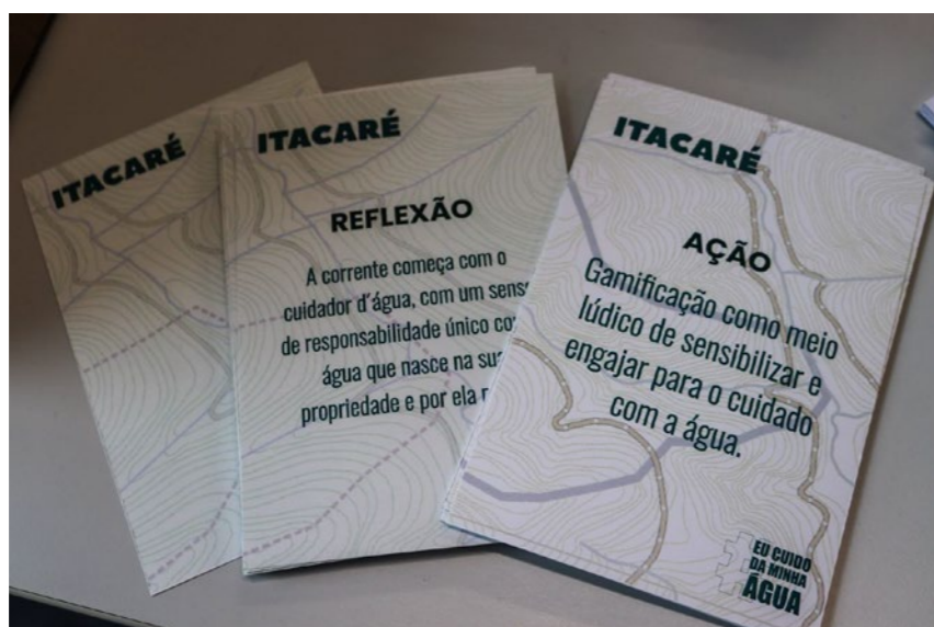
Figura 5 – Cartões disponibilizados aos participantes.

O terceiro momento, visões de impacto, teve o intuito de fazer os participantes proporem teorias de mudança para o projeto Itacaré, onde foram criados dois grupos que, com o auxílio dos materiais previamente disponibilizados (Figura 5), puderam discutir sobre suas ideias e chegar em algumas propostas. Os grupos apresentaram suas propostas de Teoria de Mudança e foram convidados a definir qual delas seria detalhada no próximo movimento. Tendo em vista a complementaridade das proposições, estas foram unificadas em um único texto.