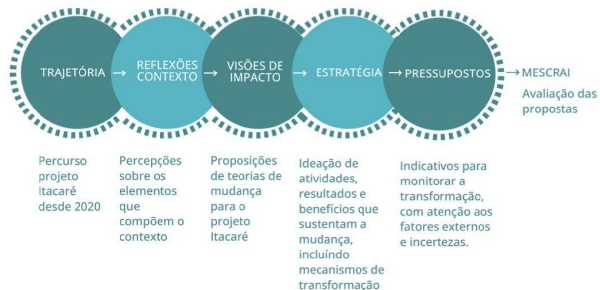
Figura 2 – Sistema dos momentos do Workshop