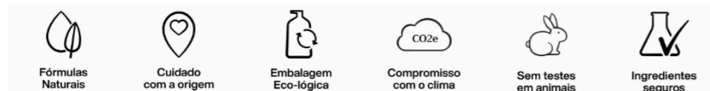
Figura 2: Ícones Natura.

a Natura, por exemplo, os valores da marca são tão importantes que ganham destaque no site, como se pode ver na Figura 2 a seguir.