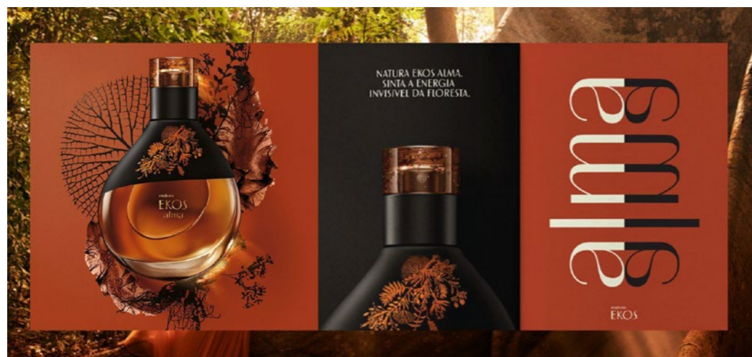
Figura 3: Natura Alma.

O perfume Alma é a exemplificação da utilização da biomimética junto aos 4 princípios mencionados acima, como pode ser observado na Figura 3.