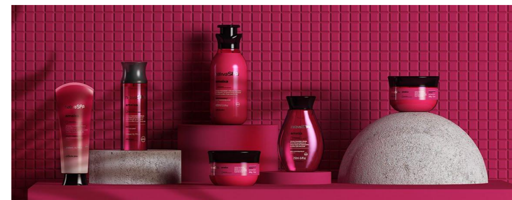
Figura 6: Nativa Spa.

Portanto, Natura e O Boticário conseguem soluções de design sustentável sem renunciar à originalidade dos produtos, quebrando as padronizações internacionais quando adicionam aos artefatos uma identidade brasileira, inspirada no bioma nacional. Por terem uma equipe multidisciplinar, com ajuda de biólogos e químicos, a visão de design não é comprometida e os produtos conseguem transmitir os valores das empresas.