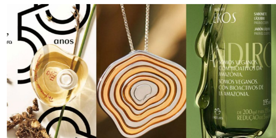
Figura 4: Trabalhos Tátil-Natura.

tipografia até a comunicação nos pontos de contato com o cliente. A proposta que teve como conceito a energia invisível da floresta, conseguiu transferir informações e formas da natureza tanto para a fragrância, quanto para a embalagem, resultando em um produto inovador e original. O Natura Ekos Alma é uma leitura profunda da Amazônia, um exemplo perfeito do que a metodologia biomimética pode proporcionar. A empresa coleciona em seu catálogo diversos outros produtos criados em parceria com a Tátil, tipografia, jóia, embalagens, frascos e comunicação, todos seguem o mesmo padrão de qualidade e inspiração, como se pode conferir na Figura 4 a seguir.