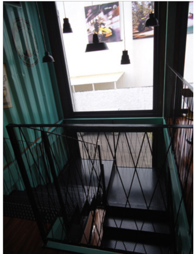
Figuras 2: Chapas e Barras de ferro

Pode-se concluir que materiais “antigos” são sustentáveis. Transmitem ideia de reaproveitamento e reuso porque remeter aos processos tradicionais. As chapas e barras de ferro, ver imagem 2, Mas, segundo avaliação de aspectos negativos percebe-se que a chapa e a barra de ferro apresenta contaminação de recursos hídricos em seu ciclo de vida, deterioração de fauna e flora, alto consumo de energia elétrica e geração de carbono segundo Lima (2006). Sendo assim, apesar de possibilidade de reciclagem (CALLISTER, 2008), precisa ser pensado se o projeto de interior está extraindo novos recursos ou realmente reciclando algo que já foi produzido inicialmente. Isso muda o todo impacto ambiental e social na escolha do material.