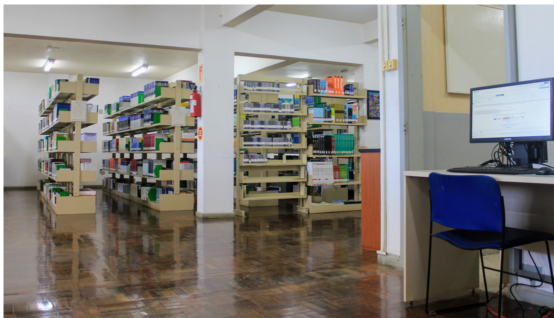
Foto: Interior da Biblioteca Setorial de Araranguá

A Biblioteca Setorial do Campus de Araranguá informa seu novo horário de atendimento a partir de 15 de maio de 2023: de segunda a sexta-feira, das 08h30min às 20h30min.