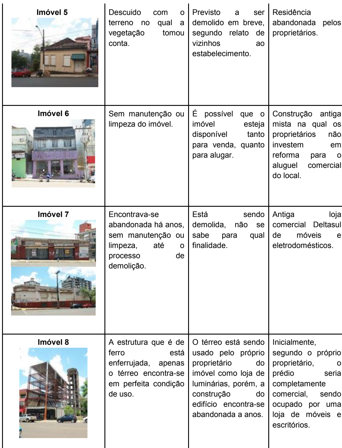
Tabela 1: Detalhamento edificações analisadas. Fonte: elaborado pelos autores.

De forma geral, todos apresentam características tais como: descuido, sujeira, acúmulo de lixo, vegetação alta, presença de animais e falta de fluxo de pessoas. Nota-se que mesmo