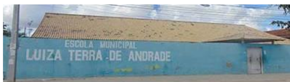
Figura 1: Fachada principal da E. M. Luiza Terra de Andrade.