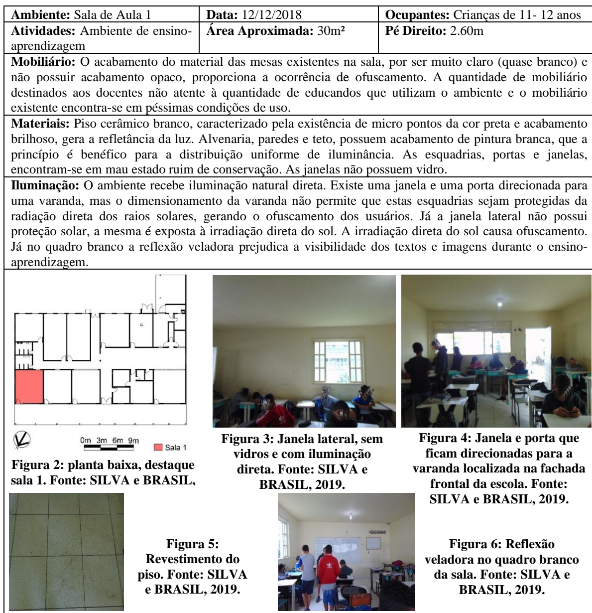
Quadro 1: Ficha de Registro da Análise walkthrough .

A análise walkthrough da E. M. Luiza Terra de Andrade foi realizada em todos os ambientes/cômodos existentes na unidade escolar e articulou os registros iconográficos com entrevistas informais com os usuários dos respectivos ambientes. Uma amostra dos resultados pode ser observada no quadro 1, que é uma ficha técnica da análise walkthrough realizada em uma das salas existentes na escola.