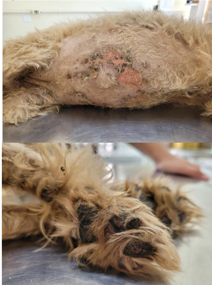
Figura 6. Lesões observadas no abdômen e coxim 18/11/2022.

O corpo foi encaminhado a necropsia no setor de patologia de pequenos animais do CAV e até o presente momento não se teve respostas laudais.