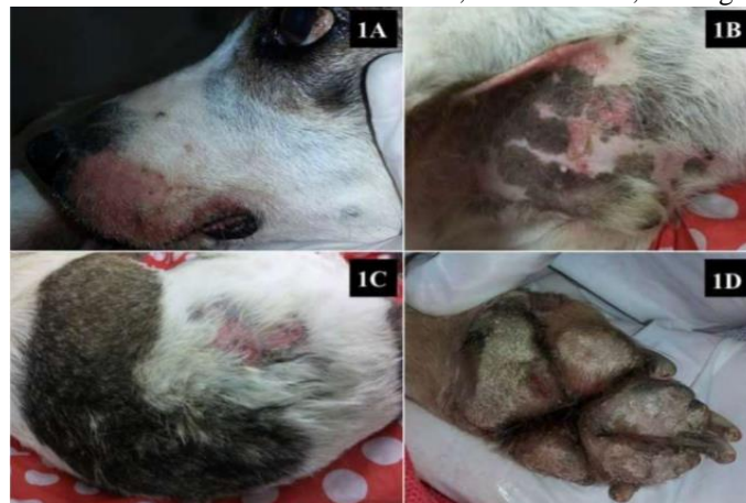
Figura 1. Lesões observadas em cão com NEM. A – face, B - abdômen, C – região dorsal, D – coxim

Na microscopia a NEM tem achados altamente sugestivos, como epiderme com hiperqueratose paracetótica com crostas serocelulares neutrofílicas, edema intracelular e necrose de queratinócitos, ocasionando uma média camada pálida e hiperplasia da camada basal (M. Isodoro-Ayza, et al. 2014).