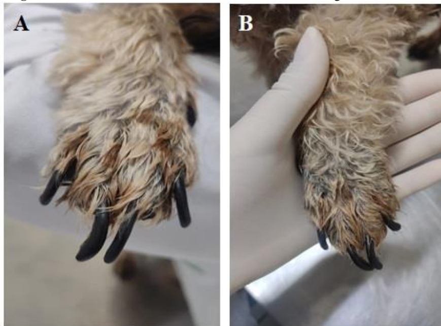
Figura 4. Lesões observadas em membros torácicos e onicogrifose 29/09/2022