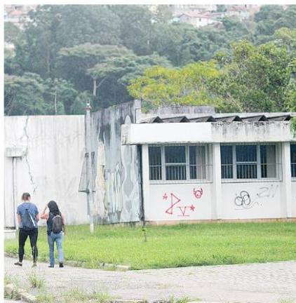
UFSC receberá este ano R$ 750 milhões em emendas parlamentares, 40% a menos do que em 2021

Ainda conforme o secretário, a UFSC também pode receber recursos via emendas parlamentares. Neste ano serão R$ 750 mil, 40% a menos do que em 2021. Esse recurso, na maioria das vezes, chega com indicativo de aplicação dos parlamentares.