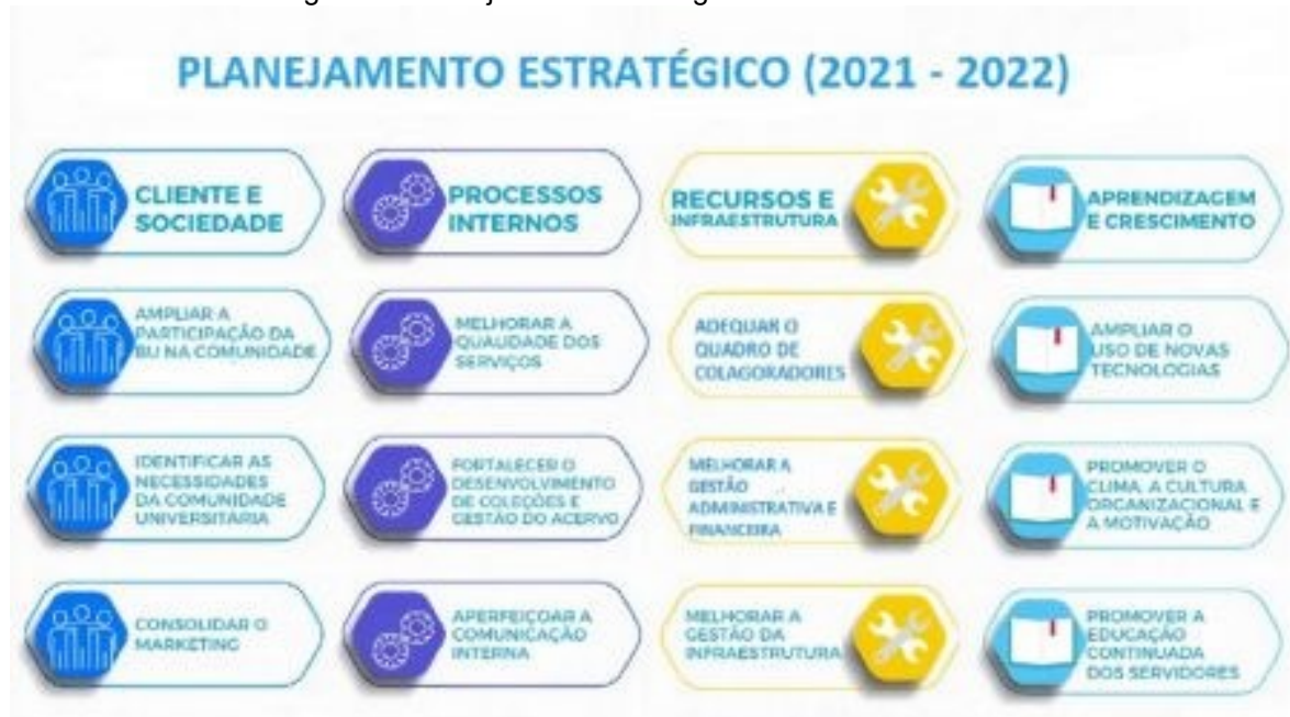
Figura 1 - Planejamento Estratégico BU/UFSC 2021-2022

Fonte: Universidade Federal de Santa Catarina (2022).