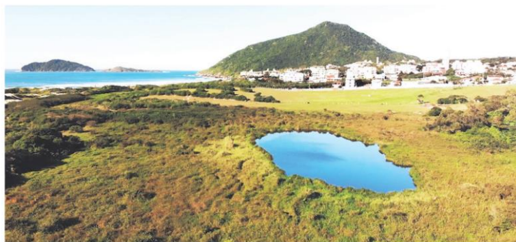
Lagoa do Jacaré está localizada próxima à praia do Santinho, no Norte da Ilha

O volume de água da Lagoa do Jacaré pode chegar a 37 mil m 3 , segundo dados do Lafic. Isso significa que dentro da lagoa podem ser instaladas quase 20 piscinas olímpicas de água doce. Sem rios que a alimentam e localizada em meio às dunas, ela pode ser classificada como uma lagoa de afloramento: quando as águas chegam até ela por meio do lençol freático e das chuvas.