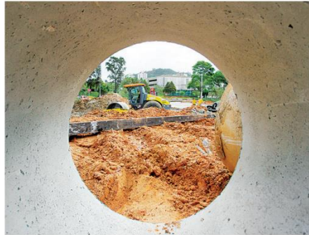
Operários trabalham na finalização de parte de uma das pistas da Edu Vieira