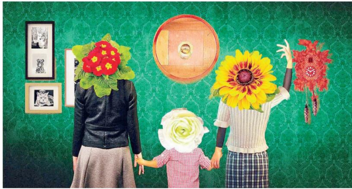
Videoclipe “Tradicional família moderna”, dirigido por Giuliana Danza, traz pais homoafetivos

“Últimos dias para ver filmes da 21ª Mostra de Cinema Infantil de Florianópolis” Últimos dias para ver filmes da 21ª Mostra de Cinema Infantil de Florianópolis / Reitoria da UFSC