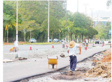
Quando concluído, trecho da Beira-Mar Norte terá corredor para o transporte coletivo

o procedimento via Floram (Fundação Municipal do Meio Ambiente).