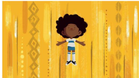
“Meu nome é Maalum” traz a menina negra brasileira que enfrenta as zoeiras dos colegas pelo nome africano

Hoje tem sessão ao ar livre às 19h na Escola Antonieta de Barros (Vila Aparecida), aberta à comunidade. Às 14h, tem também Sessão Curtas