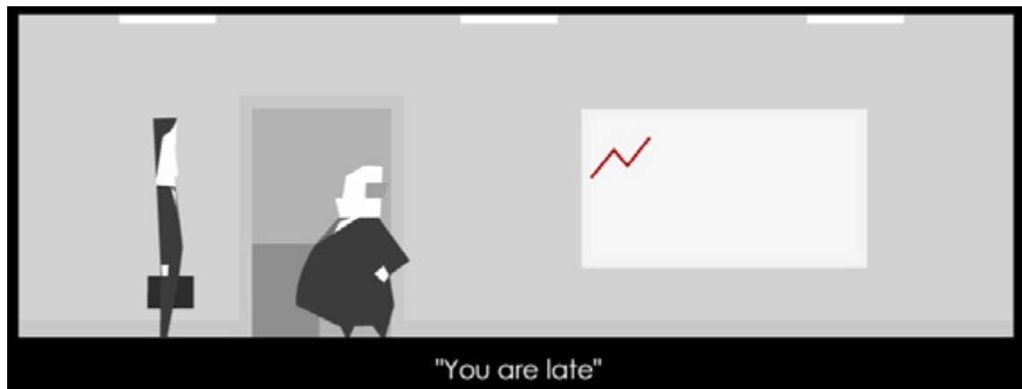
IMAGEM 3: Everyday The Same Dream / Sala Do Chefe