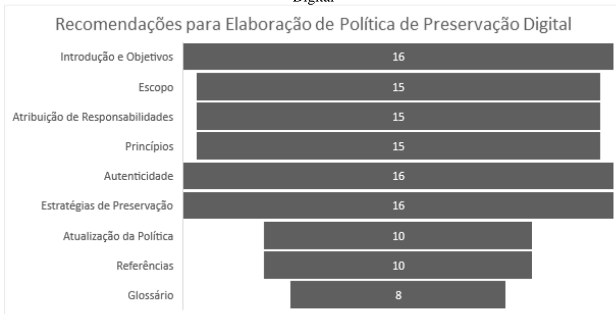
Gráfico 3 – Comparativo com as Recomendações para Elaboração de Política de Preservação Digital

A estrutura organizacional apresentada nas políticas em relação as Recomendações para Elaboração de Política de Preservação Digital do CONARQ (2019) se apresentaram da seguinte forma: