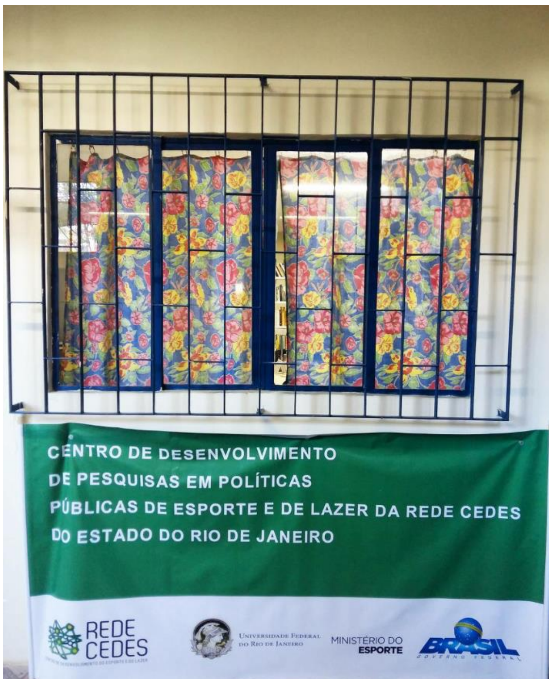
Foto da placa de identificação do Centro