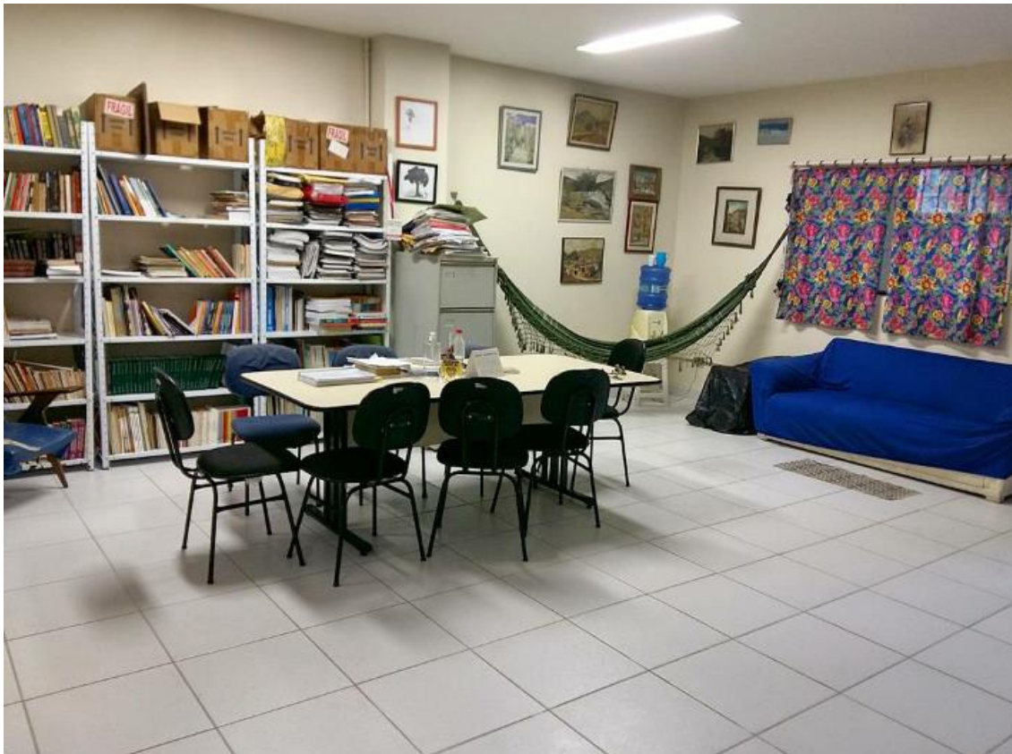
Foto retirada do site do Centro (não há mais fotos disponíveis no site)

http://www.lazer.eefd.ufrj.br/redecedes/docs/equipe.html