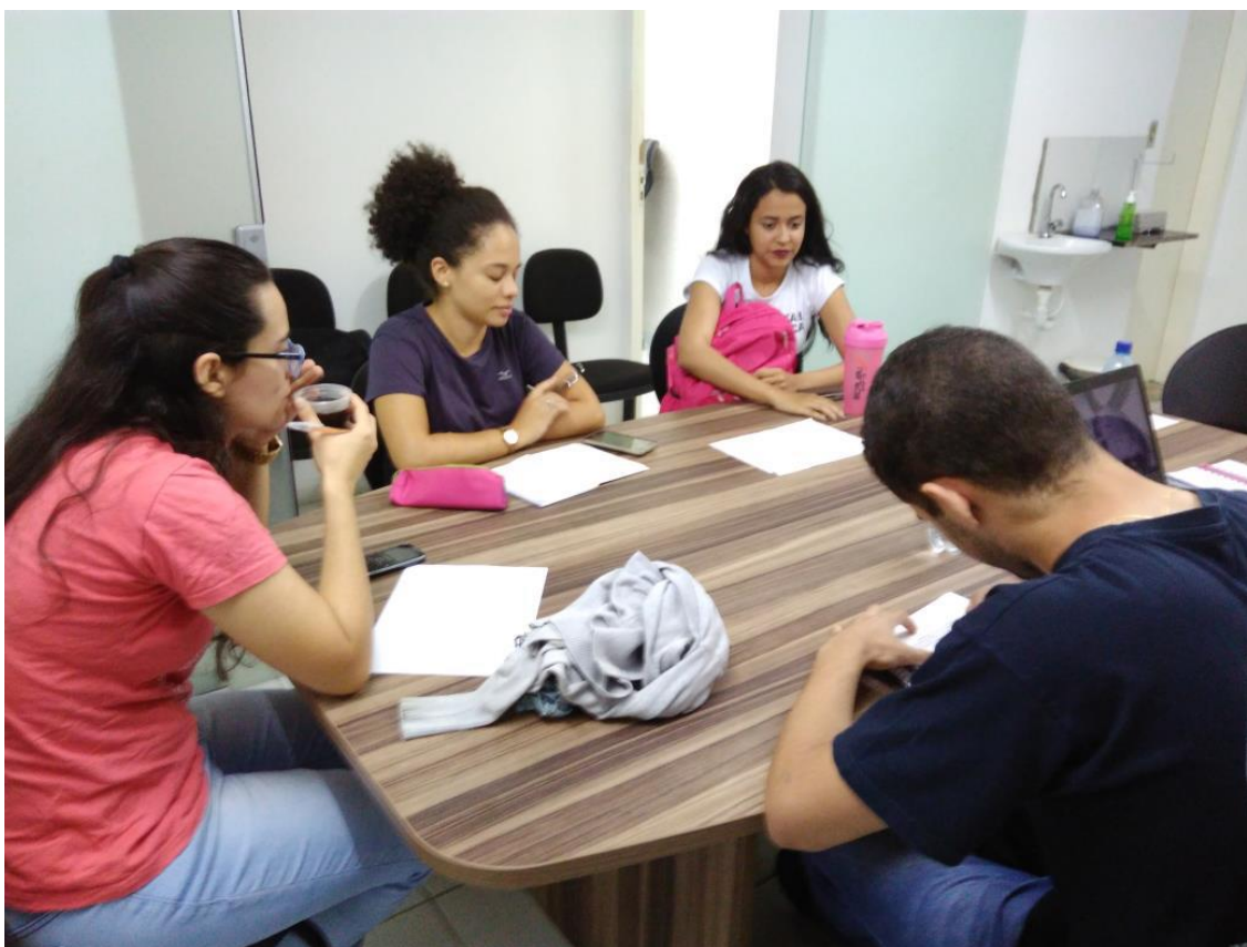
Reunião da equipe executiva