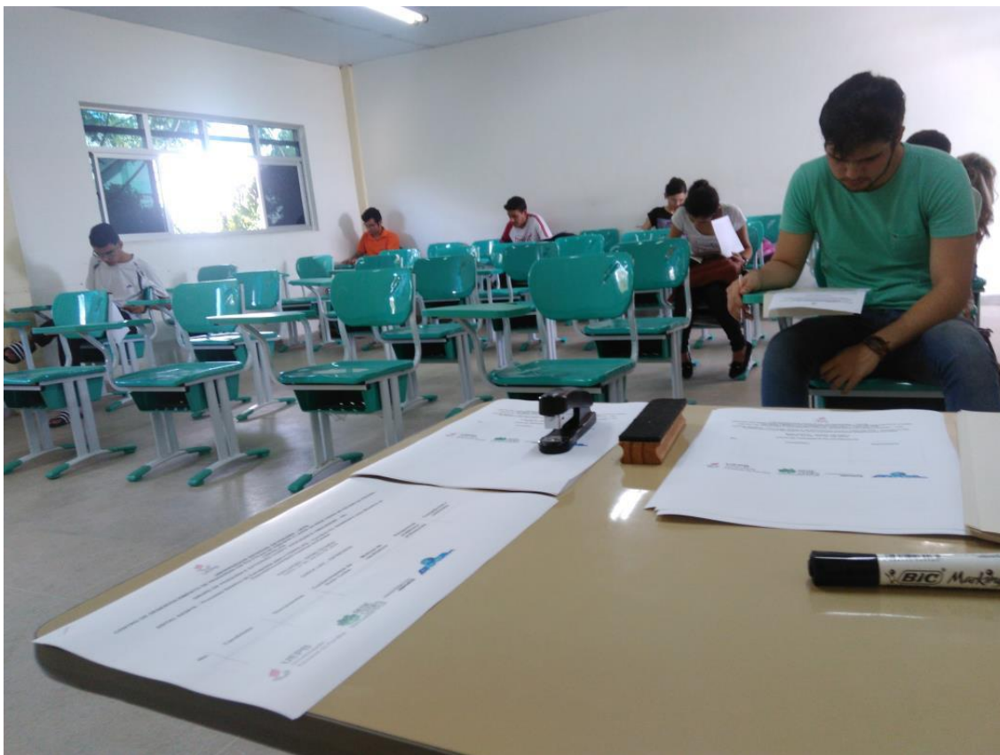
Aplicação da prova escrita no Processo Seletivo