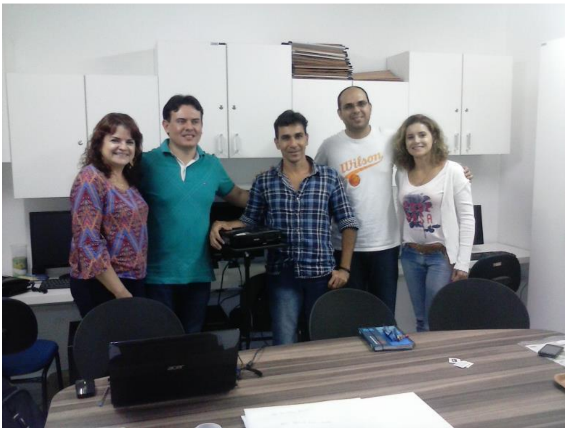
Reunião dos pesquisadores do CDPPEL/PB na sala do Grupo de Pesquisa e Extensão Corpo, Educação e Linguagens