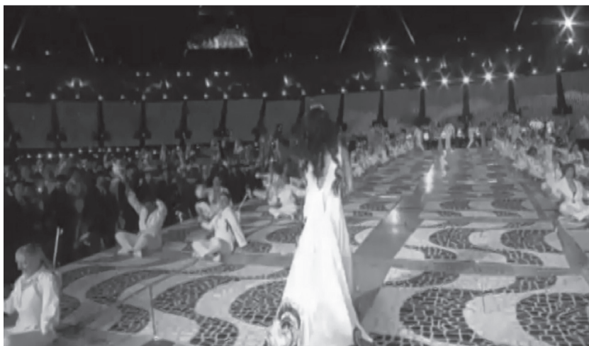
Figura 2: Calçadão de Copacabana projetado no estádio Wembley durante a cerimônia de encerramento

aceitação e receptividade dos brasileiros – tanto ao evento quanto aos seus espectadores. Junto a esses estavam: a Rainha dos Mares, Iemanjá, um símbolo mítico do sincretismo religioso brasileiro, representada por Marisa Monte; e o Rei do Futebol, Pelé, como figura representativa da identidade brasileira com o futebol. A inclusão simultânea de todos esses elementos traz a impressão de que, para os organizadores, a cultura carioca seria a representação fiel e suficiente daquilo que constitui a identidade brasileira. Cabe ressaltar que a estratégia da cerimônia de abertura dos JO de Londres foi inversa, tendo a Grã-Bretanha em sua totalidade representada na encenação, e não somente a capital inglesa, referida cidade-sede do megaevento.