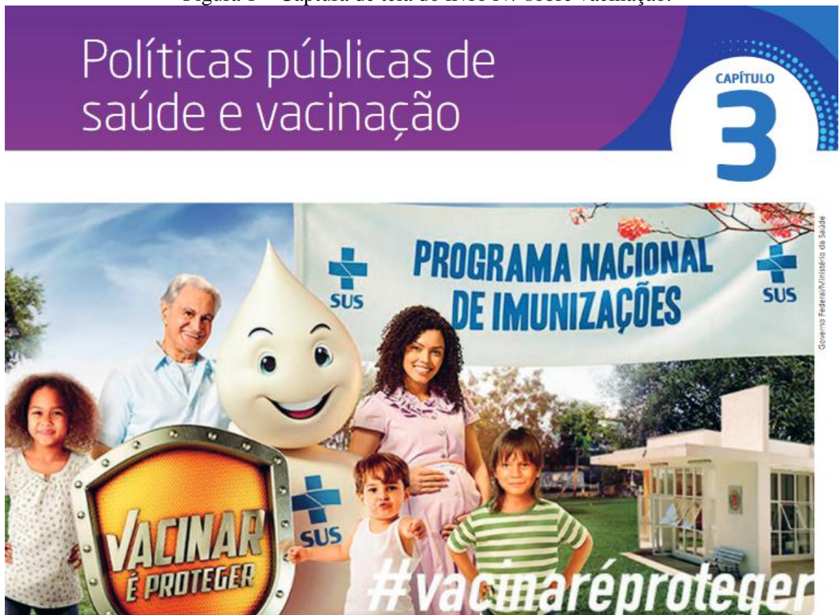
Figura 1 – Captura de tela do livro N7 sobre vacinação.