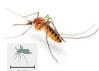
O mosquito Haemagogus é o principal transmissor da febre amarela na América do Sul.