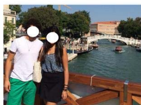
Figura 1- Postagem JAU2 em seu Instagram

JAU2 Hoje conhecemos a beleza de Veneza. Heute haben wir die Schönheit von Venedig Kennengelernt #Veneza #italia #folga #venedig #italien (JAU2, 30 de Agosto 2014, Instagram)