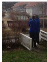
Figura 3 –Postagem JFi3 em seu Facebook

E hoje acordamos assim, com neveeeee haha sensação unica e momento maravilhoso pela primeira vez haha baita frio!! #cold #snow #Finland#Oulun #Happy se sentindo feliz com JFi3 (Post na Timeline de JFi3. 4 de maio 2014, Facebook)