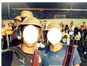
Figura 2 – Postagem JAI1 em seu Facebook

JAU2 Hoje conhecemos a beleza de Veneza. Heute haben wir die Schönheit von Venedig Kennengelernt #Veneza #italia #folga #venedig #italien (JAU2, 30 de Agosto 2014, Instagram)