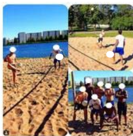
Figura 4- Postagem JFi1 em seu Instagram

JFi1 #invictos #feijaomarcos #futvolei #dayoff #finland #brasil (JFi1, 3 de Julho 2014, Instagram)