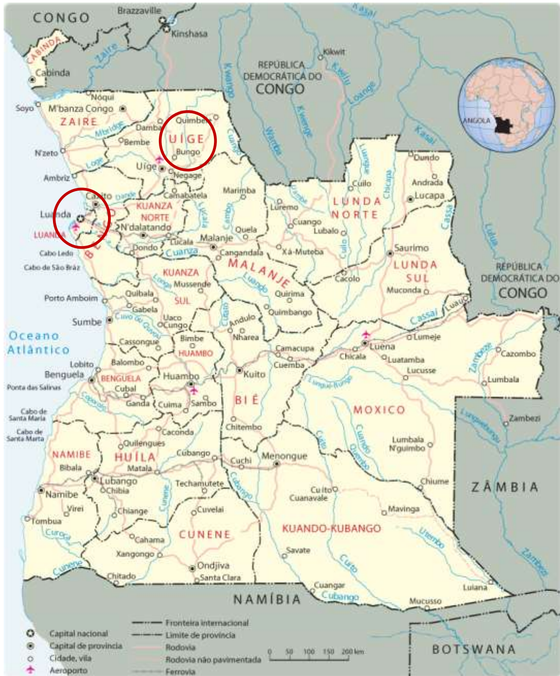
Figura 1 – Mapa de Angola