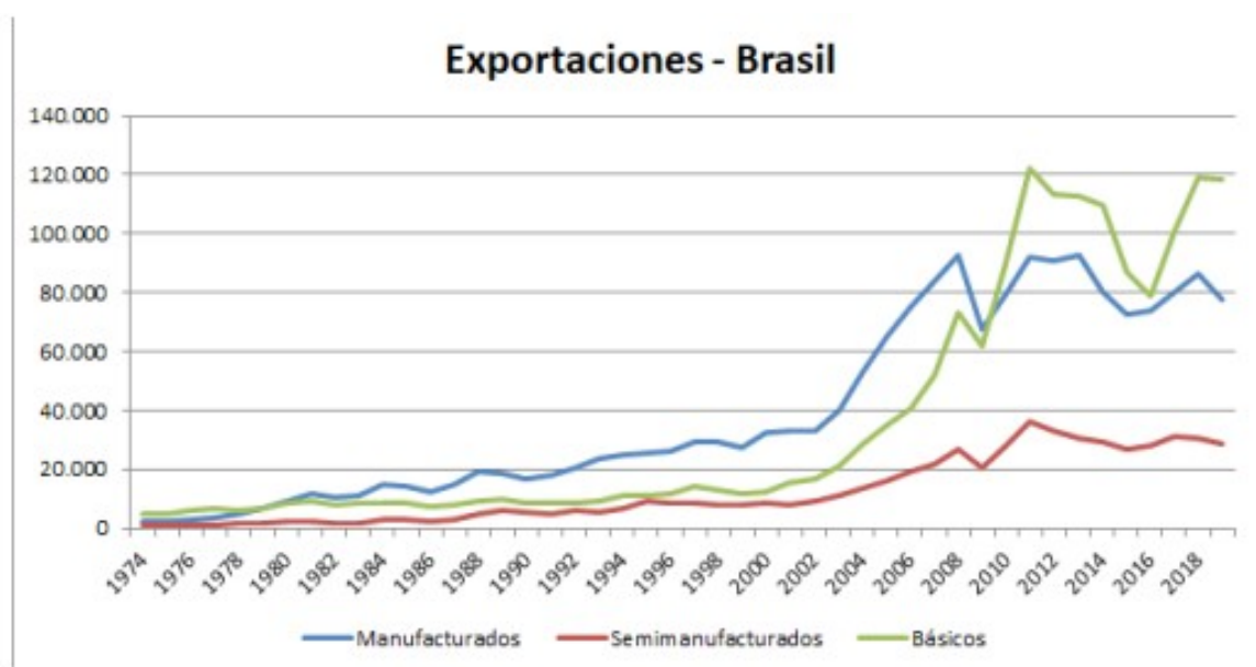
Gráfico 3. Exportações brasileiras por fator agregado (em milhões de dólares)

Fonte: Elaborado por Silva (2020, p. 388).