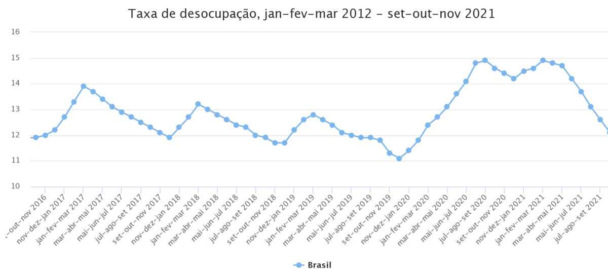
Gráfico 4. Taxa de desocupação no Brasil, médias trimestrais a partir de Agosto/Setembro/Octubro de 2016. (em %)