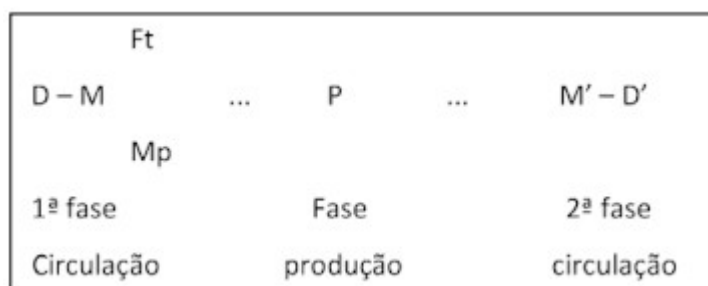
Figura 1. Os três ciclos do capital integrados