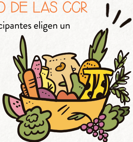
CANASTA GRANDE: a partir de 7,5 kg 12 o más artículos

Cada canasta contiene al menos: a partir de 1 tipo de hoja; 1 o 2 tipos de frutas; 1 o más tipos de verduras; 1 o 2 tipos de raíces; 1 tipo de condimento y 1 té.