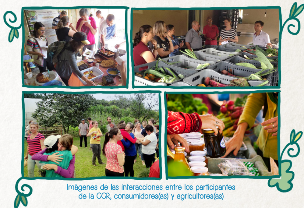
Imágenes de las interacciones entre los participantes de la CCR, consumidores(as) y agricultores(as)