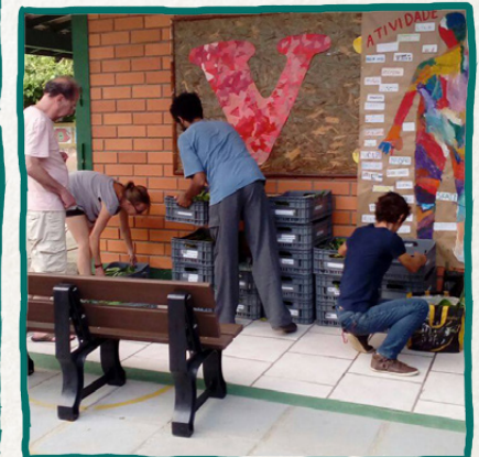
Del armado de las canastas en la casa de los(as) agricultores(as) hasta el punto de reparto