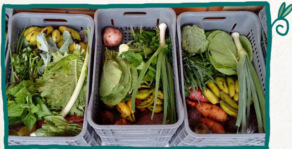
Canastas en uno de los puntos de distribución de la CCR

Cada consumidor deberá llevar un bolso ecológico o similar para retirar los productos. Los consumidores que deseen llevar un cajón para su casa deberán adquirir 2 cajones al ingresar a la CCR, para que siempre haya un cajón vacío en el punto de reparto.