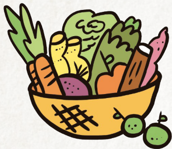
CANASTA PEQUEÑA: aproximadamente 4,5 kg 7 o más artículos

Los consumidores participantes eligen un modelo de canasta: