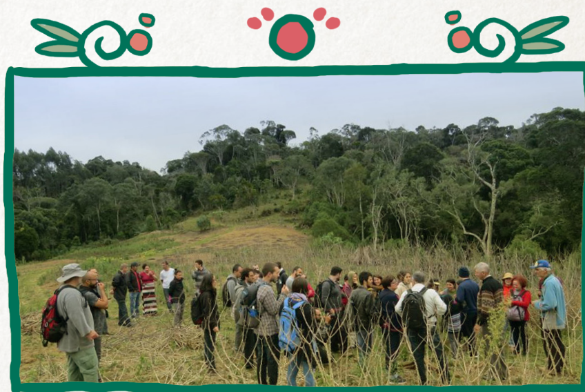
Consumidores(as) visitan las propiedades familiares de los agricultores de CCR

Estos momentos también permiten la valorización de lo local (cultura, identidad y paisajes rurales) y estimulan el turismo agroecológico, turismo rural y turismo de base comunitaria. Consumidores(as) visitan las propiedades familiares de agricultores(as) de la CCR.