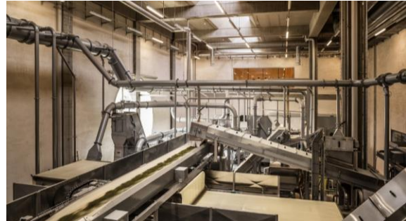
Figura 1e 2: Ricola Kräuterzentrum (Centros de Ervas Ricola) situado em um terreno descampado, em Laufen, Suíça / Paredes internas em terra e maquinário envolvido no processamento de ervas.

O comprimento do edifício reflete as etapas envolvidas no processamento industrial de ervas: secagem, corte, mistura e armazenamento. A figura 2 expõe o maquinário deste processamento. A nova fábrica de processamento permite a integração destes passos importantes na produção própria da empresa. As seções de entrada e entrega do armazém são únicas, com os paredões de barro também visíveis no interior. As grandes janelas redondas iluminam os ambientes internos e suas fachadas são autoportantes e ligadas à estrutura de concreto no interior (figura 3).