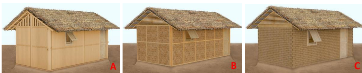
Figura 13: Modelos de abrigos, tipologias A, B e C.

É interessante observar que a tipologia de abrigo A, que utiliza tubos de papel para as paredes da construção, combina o alojamento de tubo de papel aos métodos de construção local envolvendo as amarrações de paredes com juncos e outros ramos (figura 12). Este modelo de casa pode facilmente ser montada pelos moradores e, segundo o arquiteto, como as mulheres que vivem em Kalobeyei são artesãs em técnicas de tecelagem, elas podem contribuir na “tecelagem” destas paredes (figura 9).