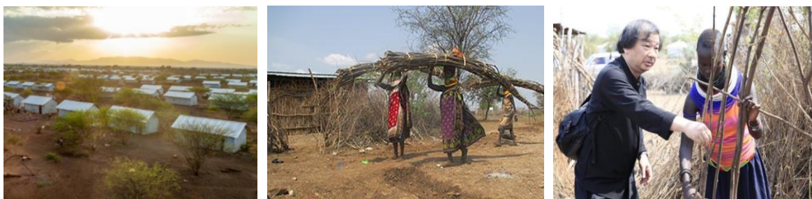
Figura 8, 9 e 10: Assentamento de refugiados no Quênia. / Mulheres do assentamento colhem materiais locais para ajudar na tecelagem de paredes / Shigeru Ban em visita para estudo das técnicas locais.

Outro exemplo que podemos fornecer de exceção às práticas de arquitetos de grife se encontra na atuação do arquiteto Shigeru Ban, referência necessária em razão de seus projetos sociais internacionais voltados para refugiados de guerra e vítimas de desastres naturais. Em 2017, a UN Habitat apresentou um projeto de planejamento urbano importante para Kalobeyei, um assentamento localizado no norte do Quênia com mais de 17.000 refugiados provenientes de países como o Sudão, e que precisava de abrigos urgentemente (figura 8). Assim, a organização do programa da ONU contatou Shigeru Ban para projetar um modelo de abrigos permanentes. (SHIGERU BAN ARCHITECTS, 2019).