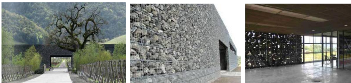
Figura 5, 6 e 7: Fachada da Adegas Dominus / Gambiões de pedras locais / fechamentos de pedra internamente “translúcidos” da Adegas Dominus. Fonte: HERZOG & MEURON, 1998. p. 16-34.

Os arquitetos utilizam pedras locais que expressam uma certa uniformidade e nudez no edifício. A técnica é adaptada ao contexto pela transformação material numa autêntica “invenção” da utilidade dos gambiões. Estes, até então, eram vistos somente como uma estrutura opaca para compor taludes e não como um fechamento “translúcido” (MULLER, 2002). Graças a este tipo de fechamento, a obra, apesar de ser uma adega, recebe iluminação natural constante em suas passagens internas e até mesmo em seus locais de armazenagem (figura 7). A Adega Dominus é tida por alguns como uma obra de arte, mas seus arquitetos nunca tiveram o interesse de que fosse vista desse modo. Eles pensam em suas obras como parte da cidade, abertas às mudanças. (POLO, 1994). Isto demonstra, na realidade, uma quebra de valores deterministas. A arquitetura não está mais por si só, ela está envolta em significados, valores e contextos sociais a serem considerados.