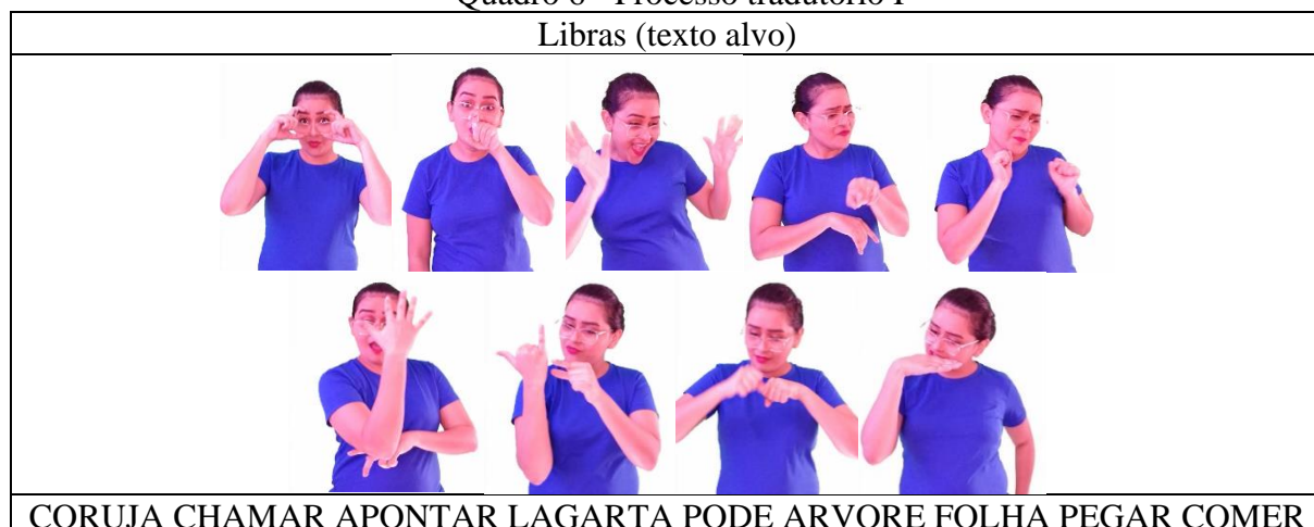
Quadro 6 - Processo tradutório F