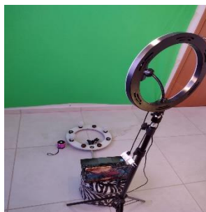
Figura 17: Pano de fundo, Iluminação e Tripe