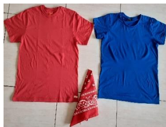
Figura 15: A roupa da tradutora usada para gravação