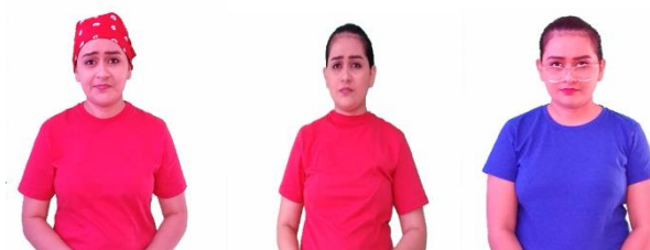
Figura 16: Imagem da Tradutora

Na primeira imagem a tradutora usa camisa vermelha com lenço na cabeça também de cor vermelha para representar o gorro do saci, com os cabelos amarrados, sem uso de brincos, na segunda imagem representa o personagem “sacis adultos” com camisa de cor vermelha e cabelos amarrados, na terceira imagem representa a “coruja” com camisa de cor azul, óculos e cabelos amarrados.