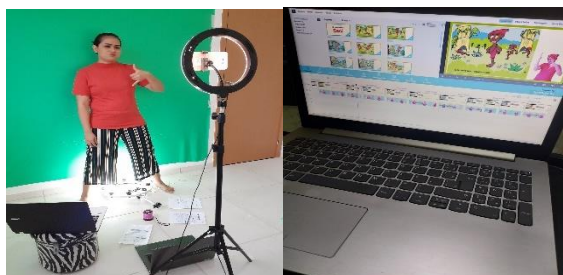
Figura 18: Gravação e edição

Durante a gravação a glosa serviu de apoio para auxiliar todo o processo de gravação do vídeo 10 . A tradutora nesse processo teve apoio de duas colaboradoras bilingue, que auxiliaram em toda a gravação do vídeo e edição. A gravação início pela manhã, e ao final da etapa já era noite, é importante refletir sobre esse processo de revisão após a gravação que é extremamente necessário para a análise e melhoria da tradução, sendo um processo muito importante quando se tem apoio de outro profissional tislp bilingue, para fazer apontamento que pode passar despercebido pelo autor, assim faz toda diferença para chegar ao produto de forma satisfatório.